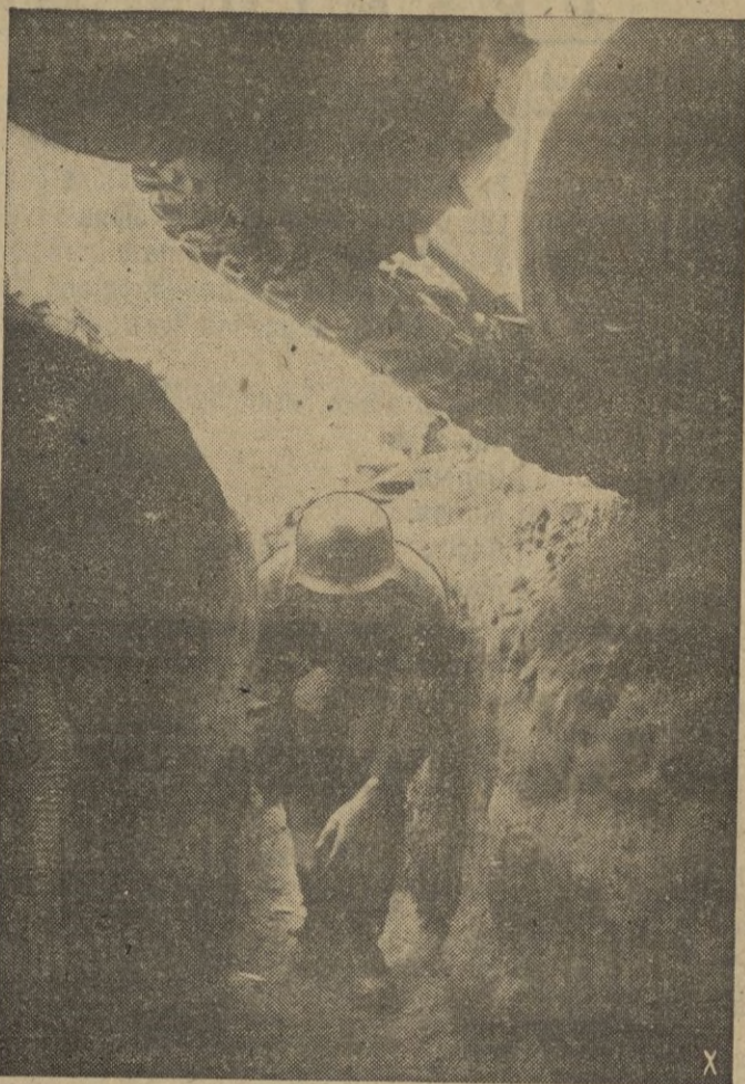
Posición avanzada alemana en el barrio de Barrikady. Los granaderos tanquistas se preparan para una acción protegidos por un tanque.