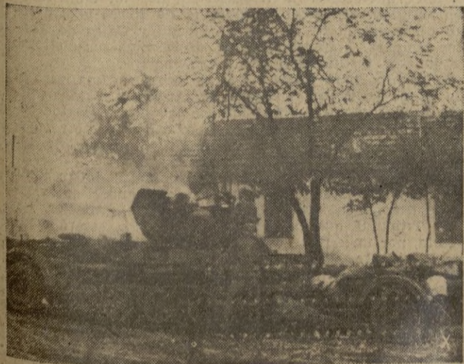
Un anti-aéreo ligero alemán combate con su fuego rápido un avión de resistencia soviético en una aldea caucásica.