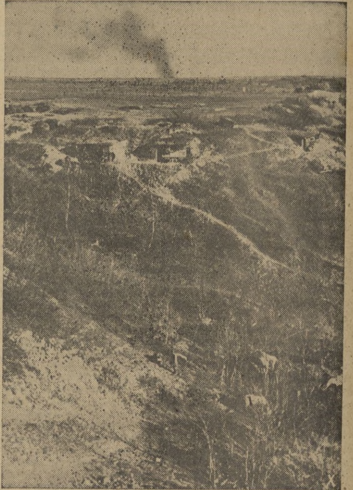
Refugios subterráneos de las fuerzas alemanas en los alrededores de Stalingrado.