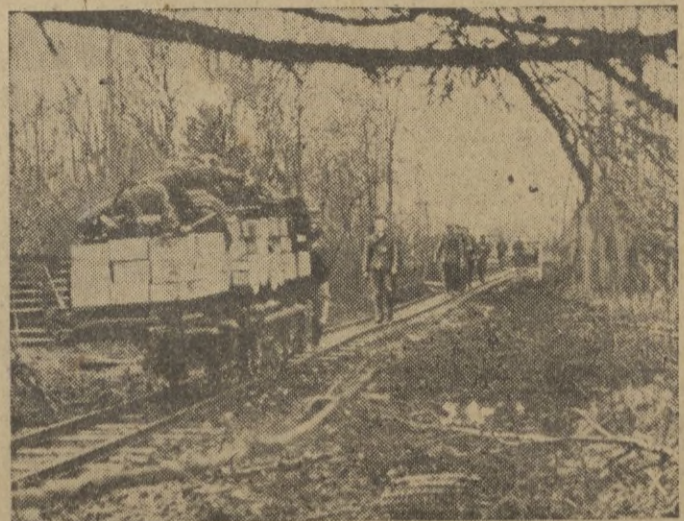
Un ferrocarril de via estrecha comunica las primeras líneas con los centros de aprovisionamiento.