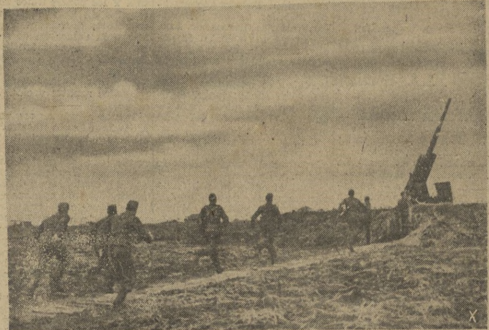
A aparecer aviones enemigos, en pocos segundos quedará listo para disparar el cañón del 8,8