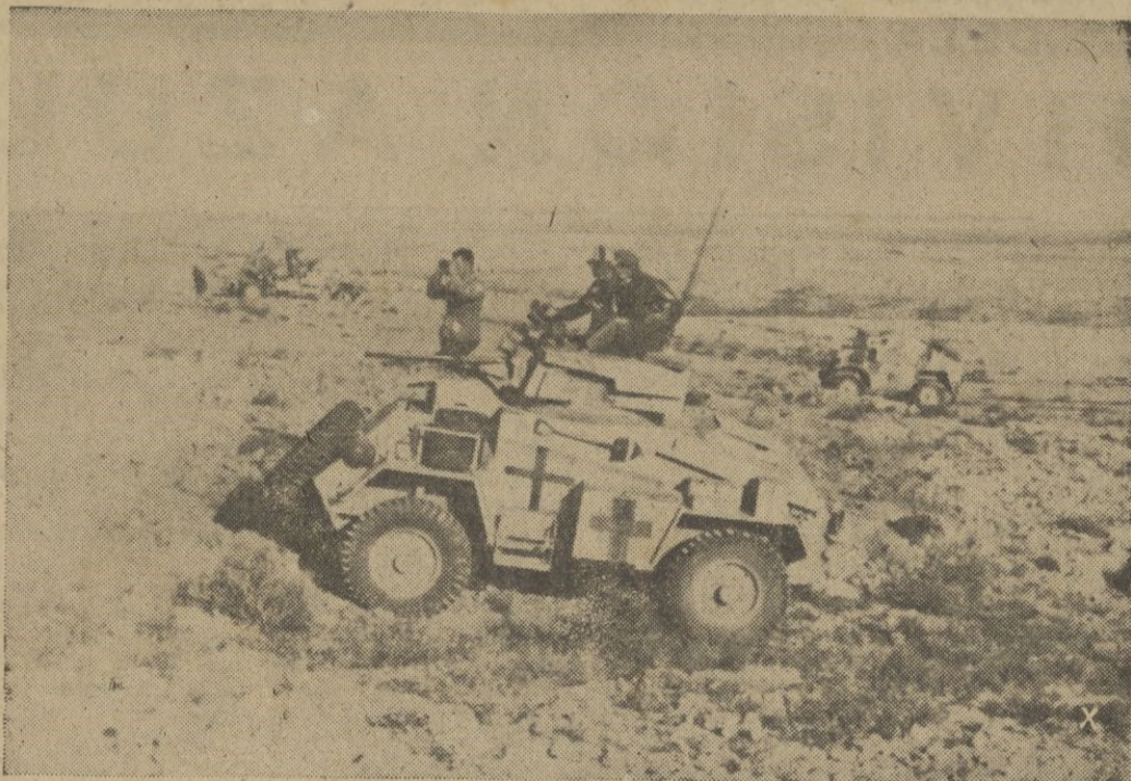
Tanques alemanes en marcha por los caminos de Túnez.