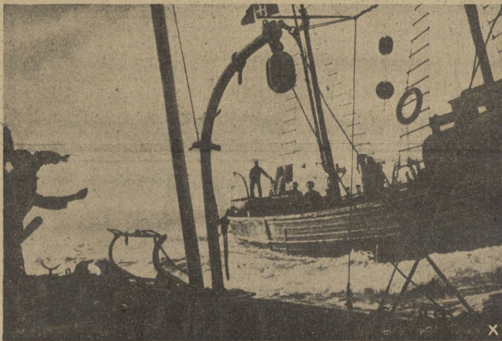
Una flotilla de dragaminas desempeña su difícil misión