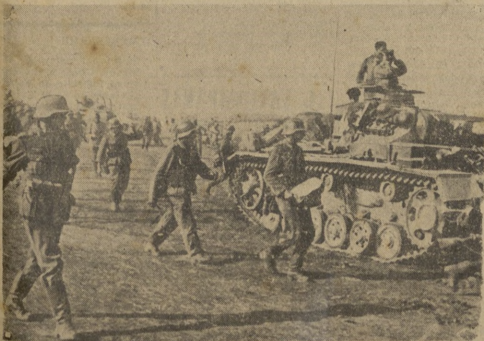
Una división alemana se prepara a intervenir con los carros de combate.

Nos sentimos fuertes y vigilantes, nos asiste la fuerza de nuestra verdad y nos resguarda la realidad de nuestra fuerza