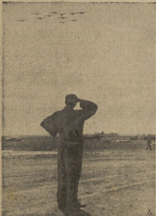
En unidades cerradas, estos aviones alemanes que regresan de un vuelo contra el enemigo, hacen su último viraje sobre la base.