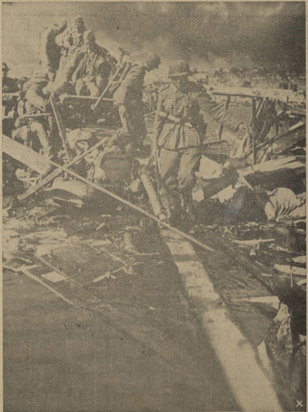
Fuerzas alemanas cruzan el Don en el mismo lugar donde quedó destrizada una columna soviética que intentaba ganar la orilla contraria