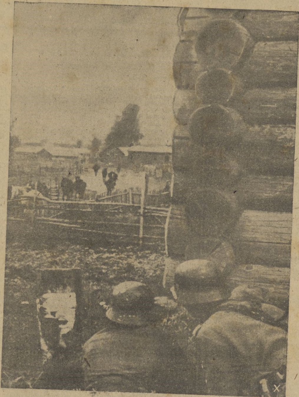
Los fusos abandonaron esta yeguada lanzándose a una huida precipitada. Los caballos, sin dueño, se acercan confiados a las avanzadillas alemanas.