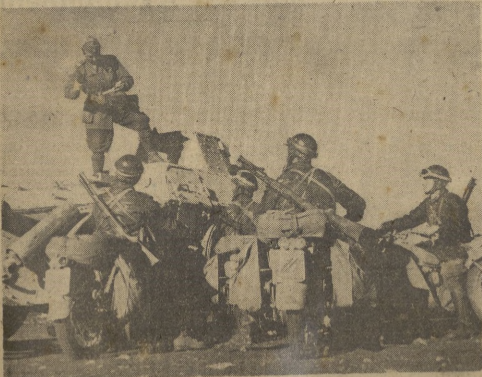
Una columna motorizada italiana dispuesta para un reconocimiento.