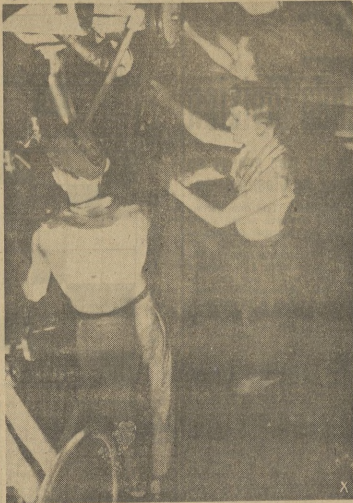
Al lado de la máquina, con un calor sofocante, los hombres cumplen su gran responsabilidad.