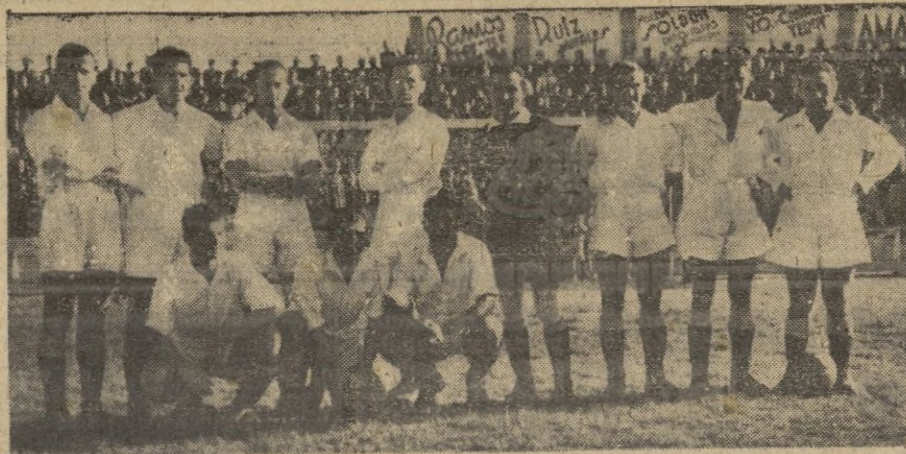
El "titular" que tan gran actuación viene teniendo en Segunda División

Se jugó este torneo, del 2 de marzo al 25 de mayo. Por la zona Oriental participaron 19 clubs y por la Occidental 14. El cuadro del Primer Tercio de La Legión se clasificó por aquella y el "Infantería 74" por ésta, celebrando el encuentro final en el Estadio ceuti Ganó "Infantería 74" por 2 a 1, tras lucha interesante, presenciada por el Excmo Sr. Alto Comisario don Luis Orgaz, que hizo entrega