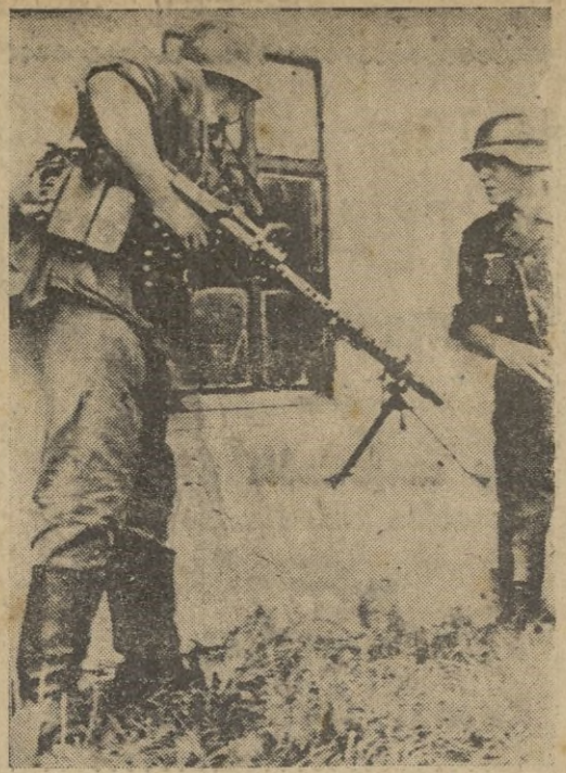
Antes de entrar en una casa desde la que los soviets han ofrecido tenaz resistencia