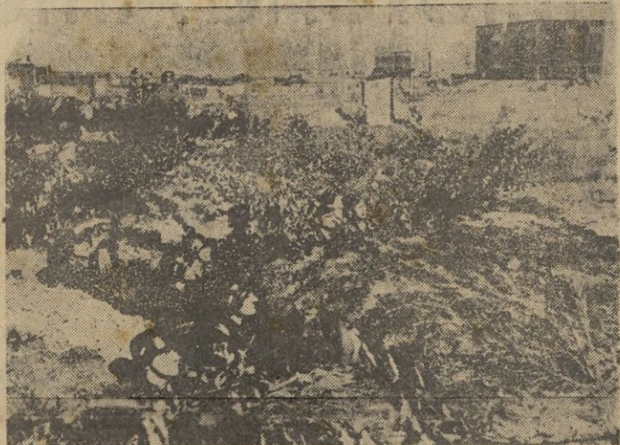
Preparados para emprender el asalto a las posiciones enemigas.