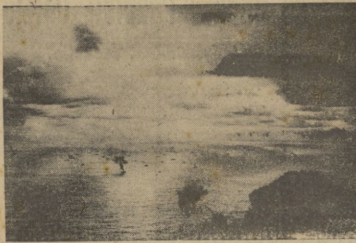
Avión de combate alemán de gran alcance ataca a un convoy inglés.