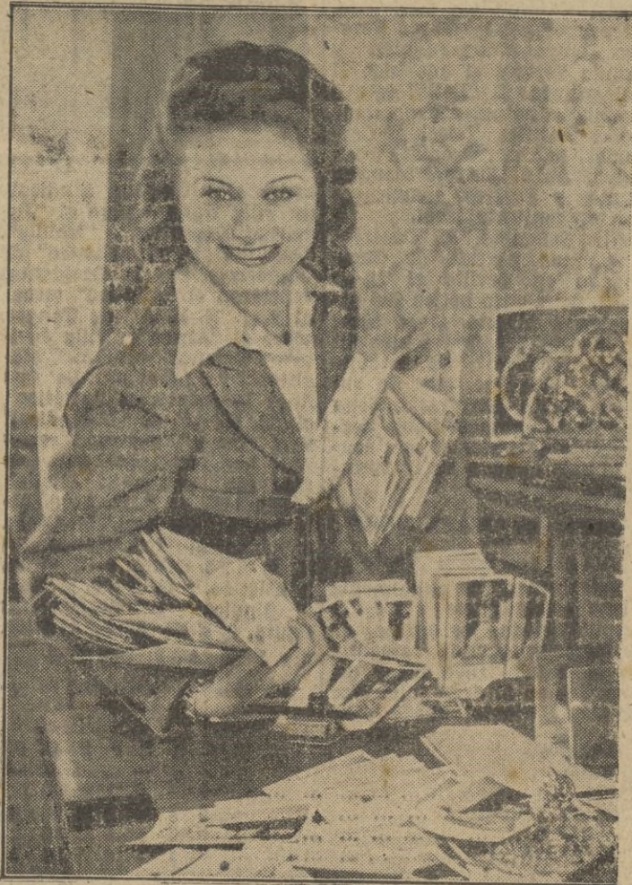
El mundo entero se ha dado una cita en la mesa-escritorio del genio de la danza Marika Rokk, cuya fogosidad y arte provocan vestiginoso entusiasmo