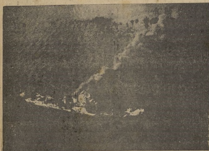
Mercante soviético de 2.000 toneladas incendiado en el mar Negro por la Aviación alemana.