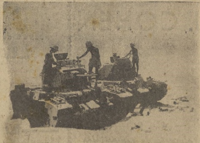
Carros armados británicos inmovilizados por la Artillería italiana.