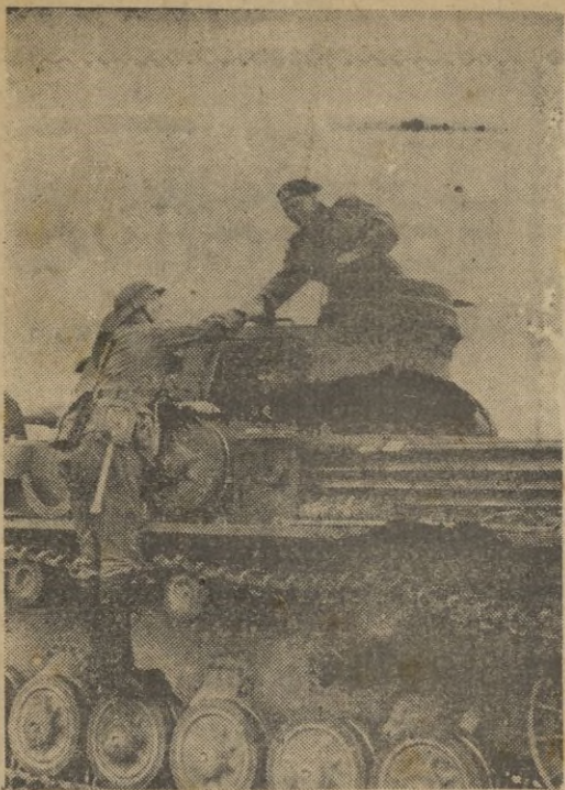
"Buena suerte", dice este soldado alemán a sus camaradas de un carro de combate que marcha a la frontera rusa.

DIARIO DE LA MAÑANA GRÁFICO Y DE INFORMACIÓN GENERAL