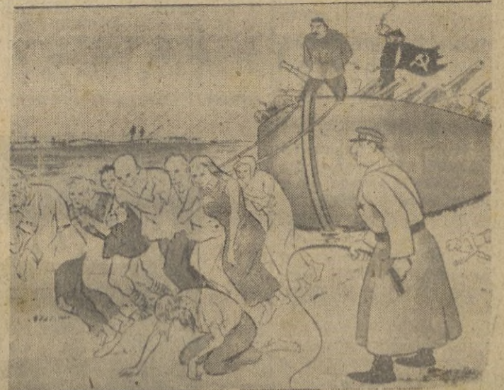
Las reservas del Ejército rojo.