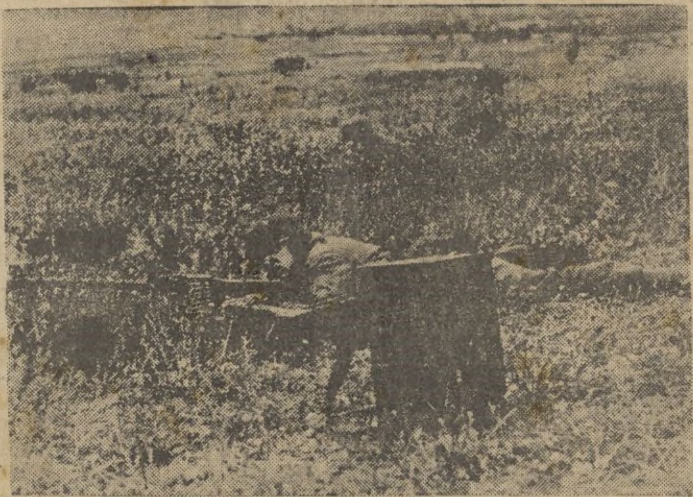
Llegados a tierra los paracaidistas alemanes aseguran el espacio ocupado.