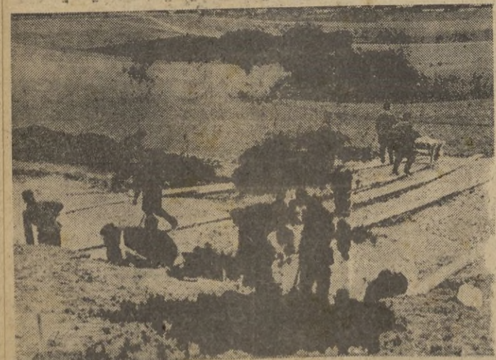
Compañías de trabajadores construyen un aeródromo de campaña.