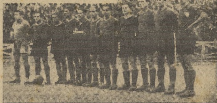
El "Ceuta", que ganó el ascenso a Segunda Liga