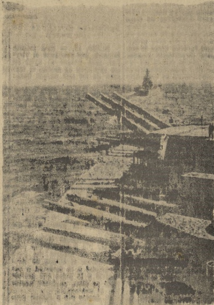
Como los grandes acorazados alemanes tienen una numerosa artillería.

"A primeros de enero de 1939, la situación de la flota japonesa era la siguiente: