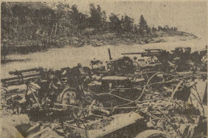
En dos lugares del frente fin es abandonaron los rojos este material.