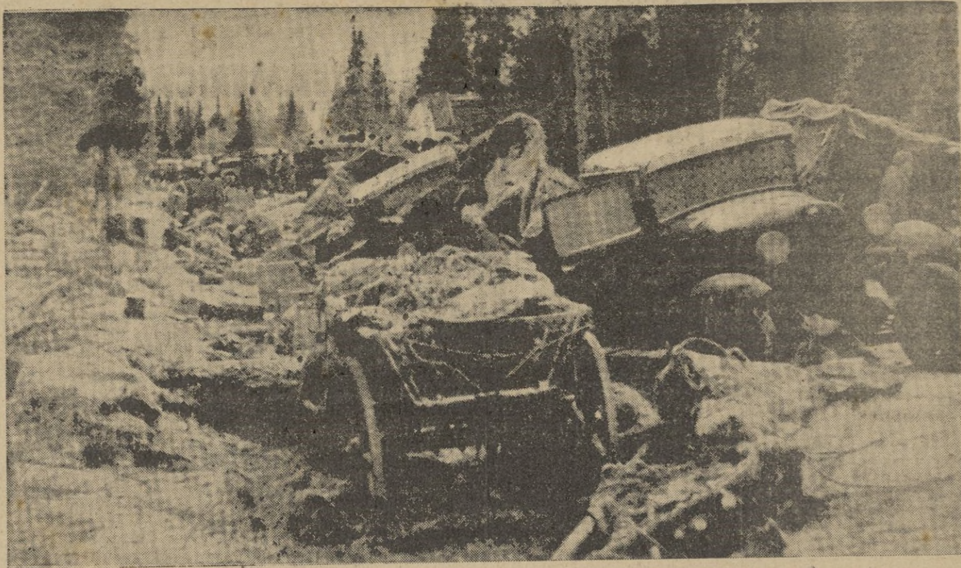
Cementerios espectrales sobre los que se desencadenó una terrible catástrofe

Helsinki. — Quien quiera hacerse una idea del destino de Europa si el aparato bélico soviético se hubiese puesto en movimiento antes de las potencias del Eje y las hordas rojas hubiesen invadido nuestro continente, debe trasladarse a Carelia.