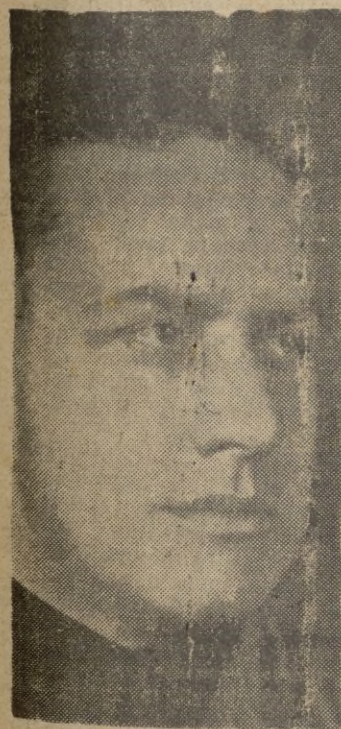
EL CONDE CIANO

HA SIDO RECIBIDO POR EL REGENTE DE HUNGRÍA