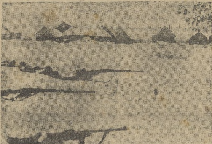
Frente ruso. -- Aspecto de los campos donde se rechaza la contraofensiva soviética.

Se trata, en su mayor parte, de caucasicos que se refugiaron en el Iran al producirse la revolución bolchevique. - EFE.