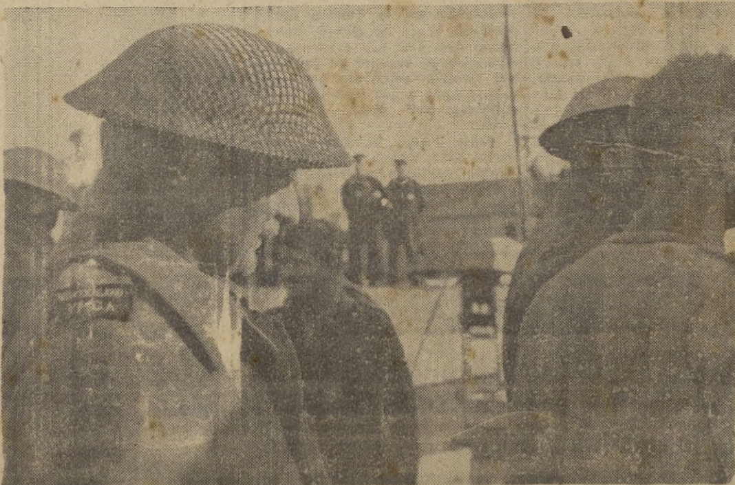
Prisionero neozelandés cogido por los italianos en los recientes combates en Africa del Norte.