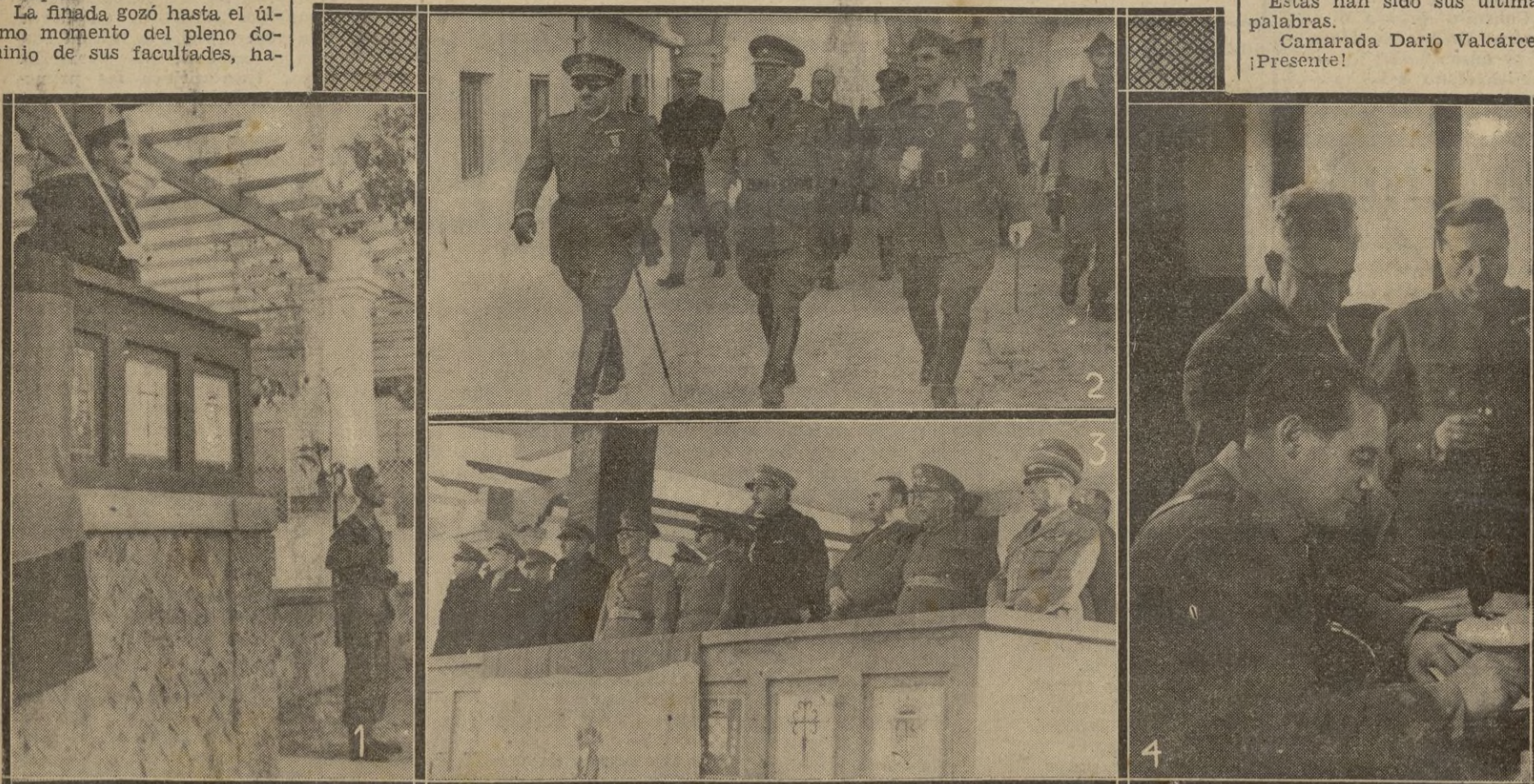
En el centro: Arriba, (número 2). Llegada del general Carvalho. Entrando en Riffien, llevando a su derecha al general Bautista Sánchez y a su izquierda al coronel Castejón. — Abajo: (número 3). Desde la tribuna presenciando los ejercicios y desfile de La Legión. -- Número 1. El coronel Castejón dando las voces de mando. -- Número 4. El jefe de La Legión firmando autógrafos a los huéspedes portugueses. -- (Foto Perea).