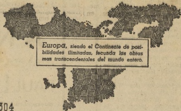
Europa, siendo el Continente de posibilidades ilimitadas, fecunda las obras mas transcendentales del mundo entero.

Hace 75 años, el 17 de Enero de 1867, el ingeniero alemán Werner Siemens presentó a la Academia de Ciencias de Berlín su célebre informe sobre su primer dinamo inventada ya por él en 1866. Con su descubrimiento del principio dinamoeléctrico, Siemens proporcionaba al mundo el medio para engendrar corrientes eléctricas de la intensidad que se deseara. De la realización de esta idea se beneficia hoy el mundo entero con la aplicación de la electricidad en todas las actividades humanas.