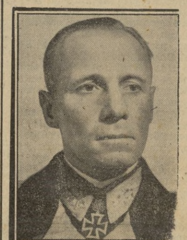
El general Rommel, que manda las fuerzas que reconquistaron Agedabia.

En estas operaciones, dos concentraciones de transportes mecanizados del enemigo fueron bombardeadas y ametralladas con éxito y se observó que sufrieron muchas bajas. — EFE.