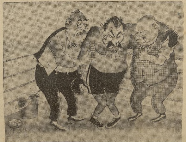
Antes del último round

Los aviones alemanes prosiguen con éxito sus ataques contra las instalaciones militares en Cirenaica.