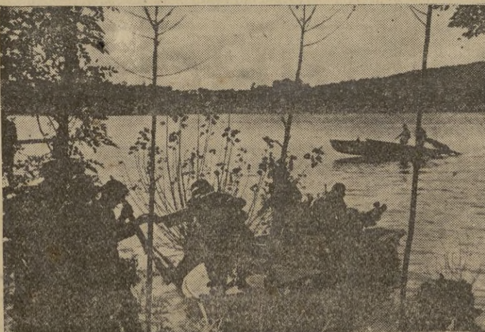
Costas rusas. -- Lanchas rápidas alemanas prontas a ir en busca de enemigo.

Los japoneses ocuparon Labis el 22 de enero y preparan una acción contra el triángulo Yongperg-Ayericam-Kluang donde los británicos