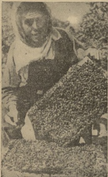
El apicultor saca el cuadro de una colmena

Más tarde, en el siglo XVI, fué un español el que dió a la imprenta el primer libro del mundo en el que se trata de la apicultura: en 1586 y en Alcalá de Henares, se imprimió el primer tratado de Apicultura de que hay noticia. Su autor es Luis Méndez de Torres. Este autor tuvo como detalle interesante, el de anticipar casi en un siglo a Swammerdamm el admirable naturalista holandés, en el descubrimiento del sexo de la reina. Poco después, en 1622, Jaime Gil, natural de Magallón, (Zaragoza) hacía imprimir en esta ciudad otro libro de apicultura y se conocen por lo menos cuatro manuales apícolas del siglo XVIII de autores españoles, siendo de