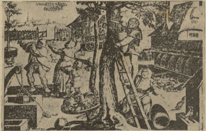
Un curioso grabado sobre la apicultura en Alemania en el siglo XVI

Portada del primer libro publicado sobre apicultura en el mundo, impreso en Alcalá, en 1586