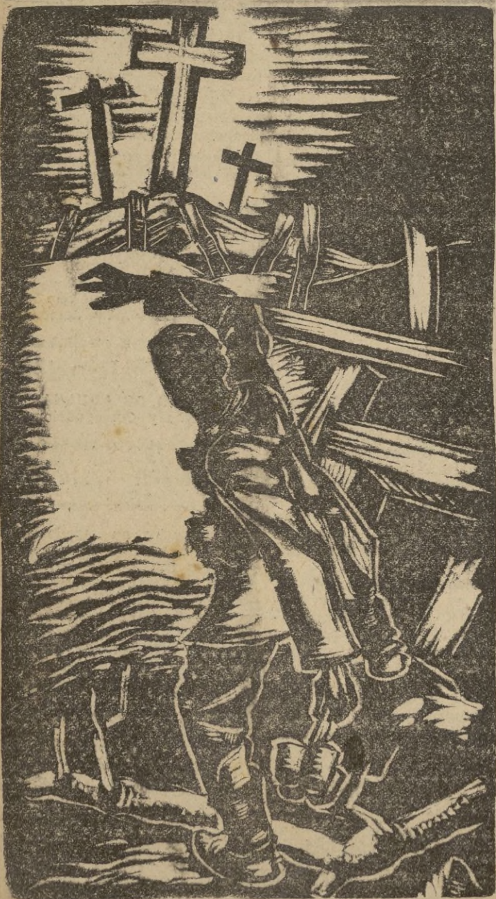
Linogravado del marqués de Soos Caragea, uno de los magníficos trabajos que figurarán en la Exposición que se inaugurará el próximo domingo.

Nosotros lo celebramos, ya que se trata de unos artistas tan modestos y trabajadores, dignos por todo del aplauso que nuestro público les otorga cada noche de actuación.