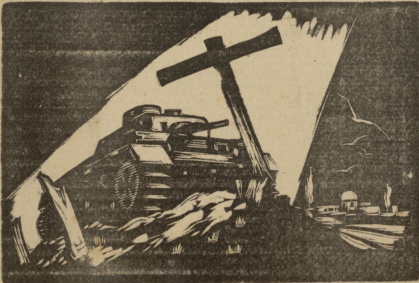
Estado del marqués Soos Caragea, uno de los notables trabajos que presentará en su Exposición del próximo domingo.

Se espera que en el presente año la producción será un 250 por ciento más elevada que en el 1941. También se espera que en el año 1942 la producción de buques mercantes, sea igual a la producción alcanzada por la Gran Bretaña. —EFE.