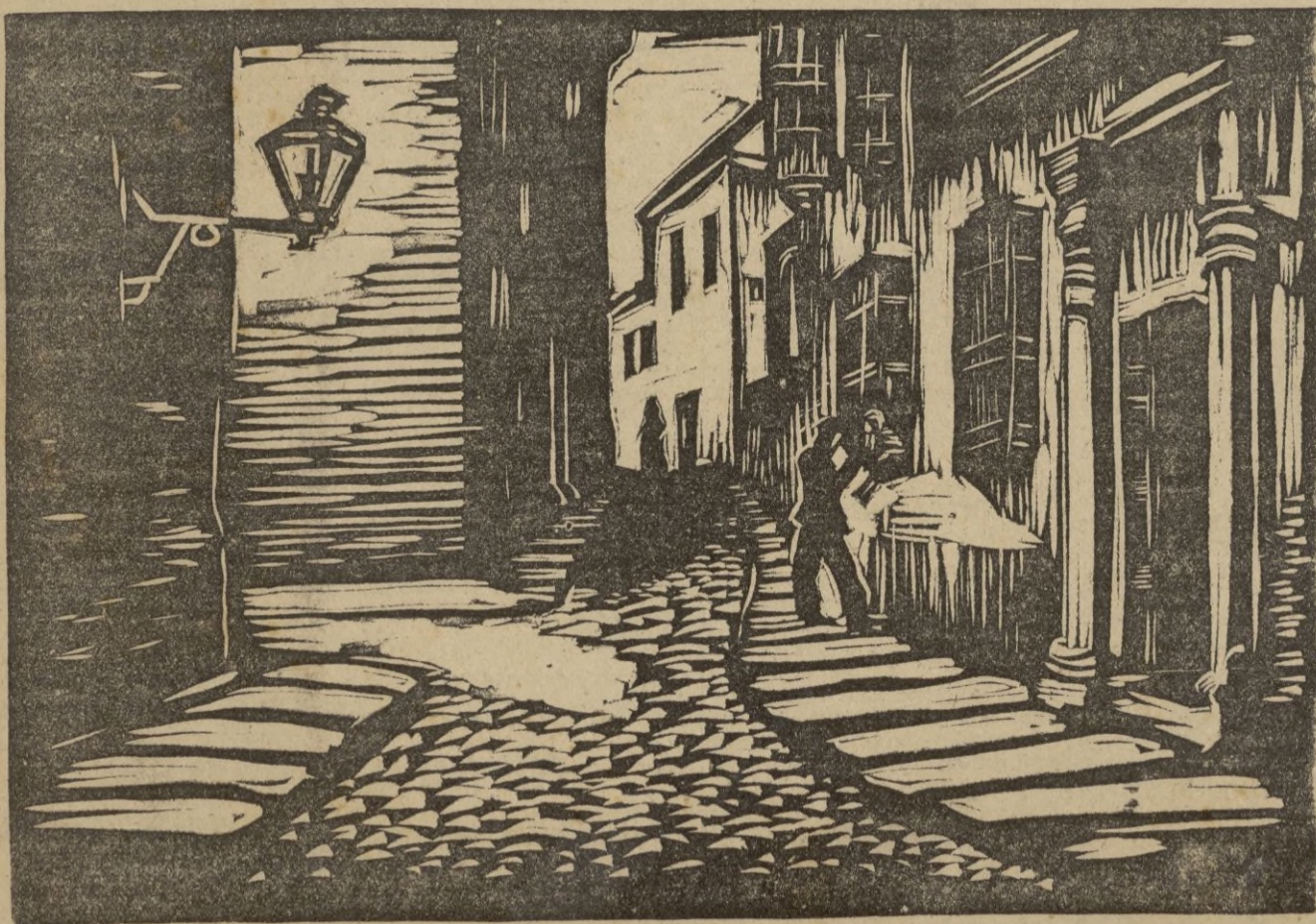
Una típica calle de Cádiz, linograbado original del artista rumano marqués de Soos-Caragea, una de las obras que forman el maravilloso material de la exposición que con destino a engrosar la suscripción para los heroicos voluntarios de la valiente División Azul se abrirá muy en breve, bajo los auspicios de la Jefatura local del Movimiento en el salón de actos del Hogar de F. E. T. y de las JONS

Ginebra, 10. — El "The Times" en su edición de ayer y refiriéndose a la situación de la escuadra británica, dice que los pocos cruceros de que dispone Inglaterra, están casi en su totalidad en reparación, como consecuencia de las averías sufridas. Sigue manifestando el mismo periódico que ningún barco de los que componen la escuadra británica ha cumplido las esperanzas que el pueblo inglés tenía puestas en ella. — EFE.