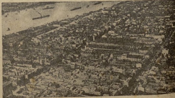
Una vista general de Rangún.