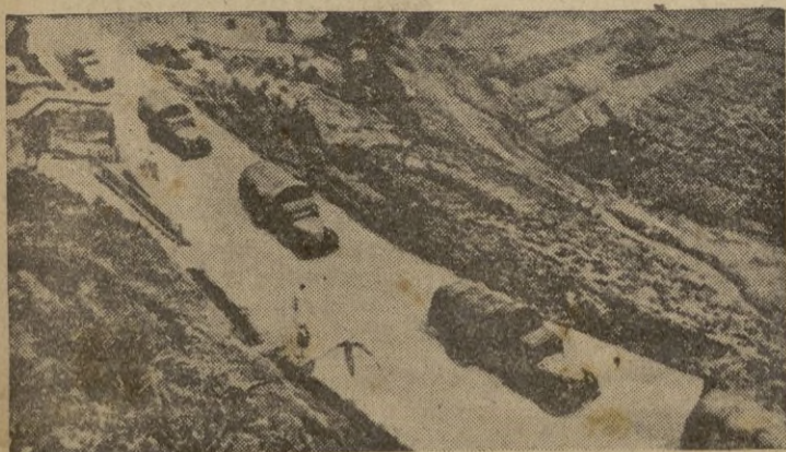
Carretera de la región montañosa de la ruta de Birmania.

Mira quien está a tu lado en el espectáculo o en el coche. Si no quedas satisfecho, toma INMEDIATAMENTE y LUEGO tus medidas.