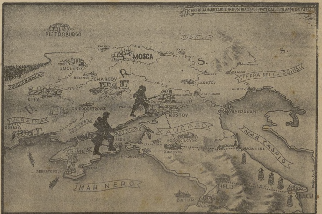
Centros de alimentación e industriales ocupados en Rusia por las tropas del Eje, según la Prensa italiana.

Fué muy aplaudido y felicitado el orador al terminar su interesante disertación. — CIFRA.