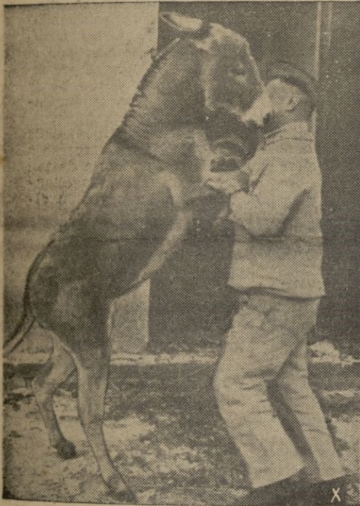
Esta burra con la cual parece ser que juega este zapador alemán, es muy considerada en su compañía de la cual es mascota, un poco gran decita.