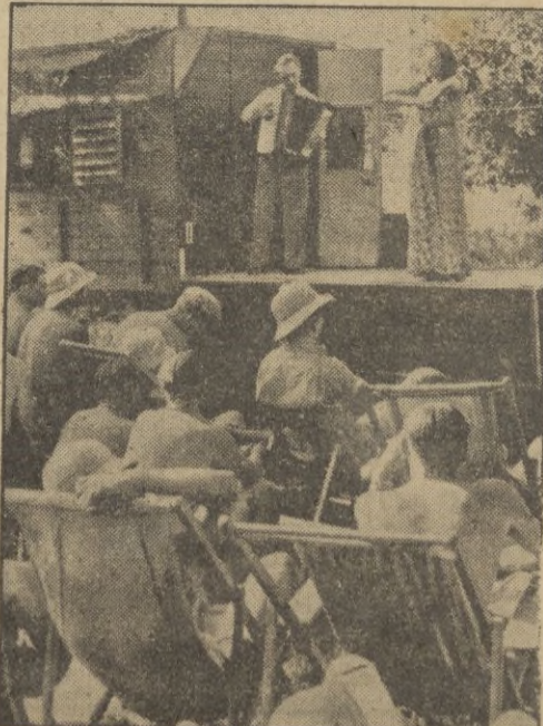
Artistas alemanes representan para los soldados

Washington, 2. 3 m. — En la última media hora del año fiscal que concluyó en la noche del 30 de junio se votó en el Parlamento de los Estados Unidos un crédito de 45.000 millones de dólares, de los cuales 42.000 están destinados al Ejército. — EFE.