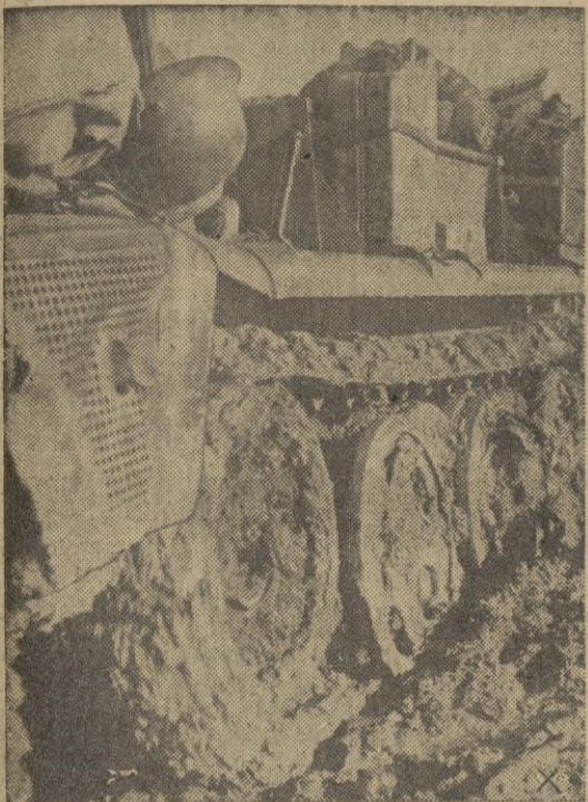
A pesar del blando terreno, las columnas motorizadas cumplen su misión de perseguir y derrotar al enemigo en fuga.