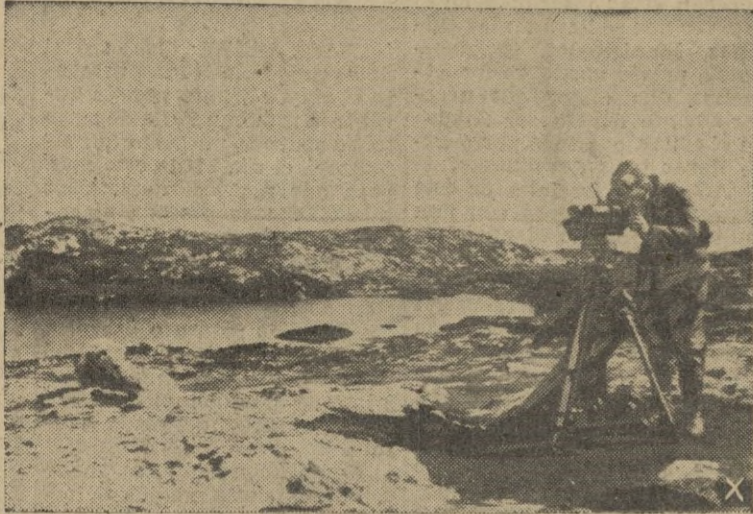
Mientras los ejércitos alemanes y amigos vencen al adversario en los frentes del Sur de Rusia, se extrema la vigilancia en el Norte. He aquí un puesto de observación antiaérea en un punto solitario y avanzado.

Berlín, 7. (1 m.) — A 97.000 asciende el número de prisioneros capturados en Sebastopol, según las últimas informaciones recibidas.