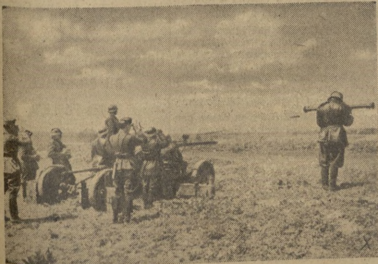
Tropas húngaras rechazan con cañones antiaéreos un ataque de tanques soviéticos.

El ministro de Agricultura y Aprovisionamiento informó acerca del insuficiente abastecimiento en las grandes ciudades de legumbres y frutas.—EFE.