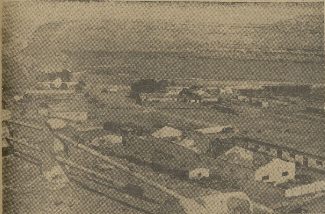
El puerto de Bardia después de la reconquista.

El Don está alcanzado en una extensión de 350 kilómetros