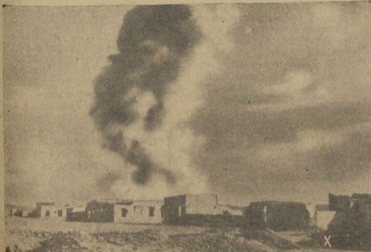
Posición inglesa del frente egipcio que fué conquistada por las fuerzas del Eje después de un breve bombardeo

El Gobierno ha dirigido un nuevo llamamiento a los campesinos amenazándoles con severos castigos para el caso de que no cumplan las citadas disposiciones. -- EFE.