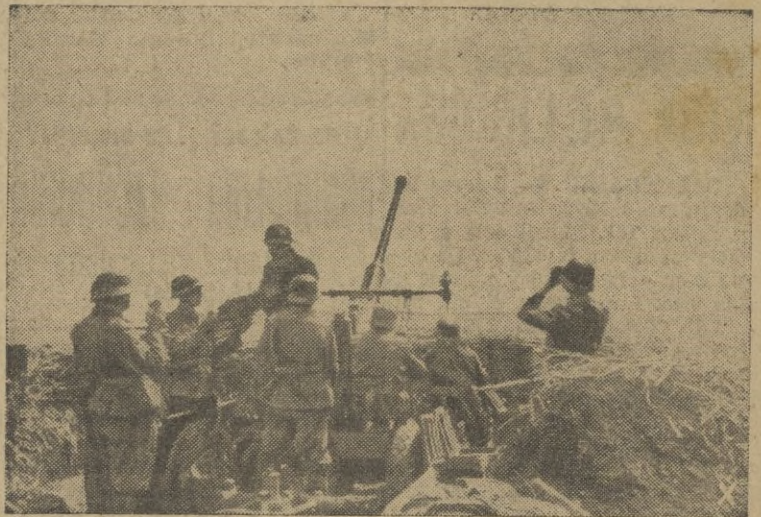
Un puesto de la D. C. A. húngara en el recodo del Don.

En el recodo del Don el enemigo ha sido debilitado y sus