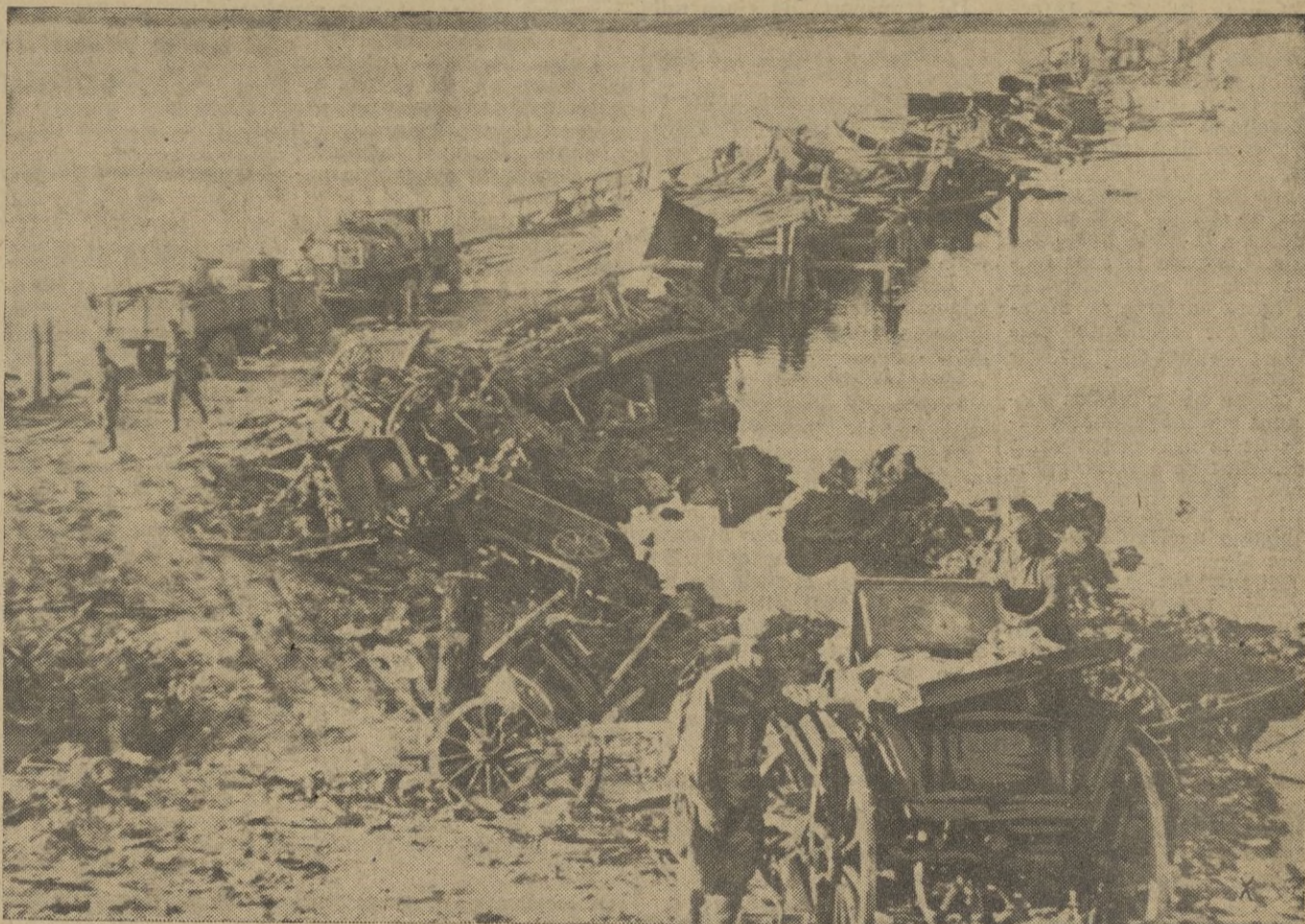
La artillería y los "Stukas" alemanes acabaron en pocas horas con todo un ejército rojo que intentó en vano alcanzar la orilla contraria del Don.