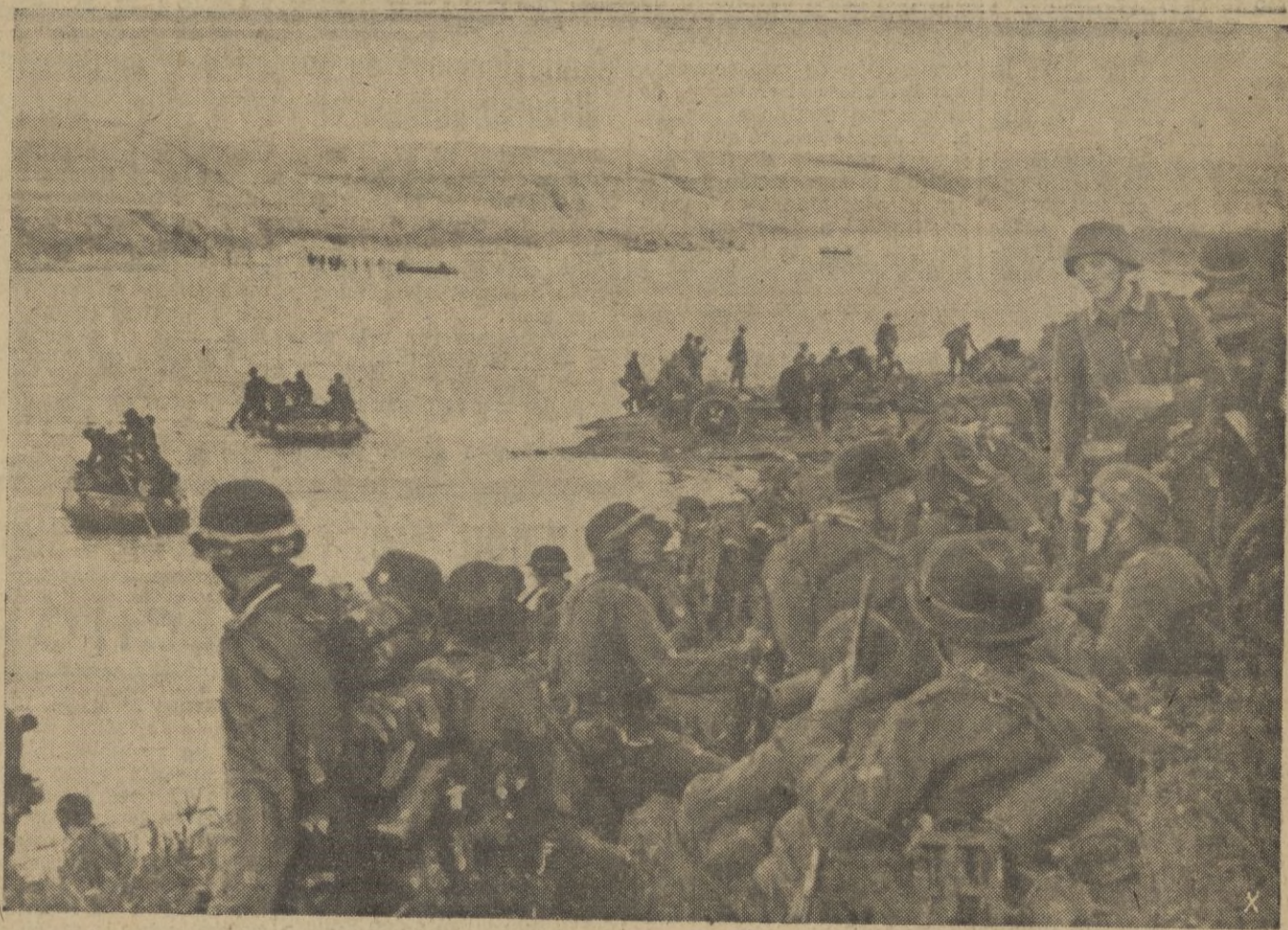
Importantes fuerzas de choque alemanas se disponen a cruzar un afluente del Don para lanzarse al asalto de Rostov.

to de la gestión estatal es tan grande, que la improba labor ya realizada nos permite comparar ventajosamente la situación de hoy con la que hubo que vencer en los comienzos de la victoria.