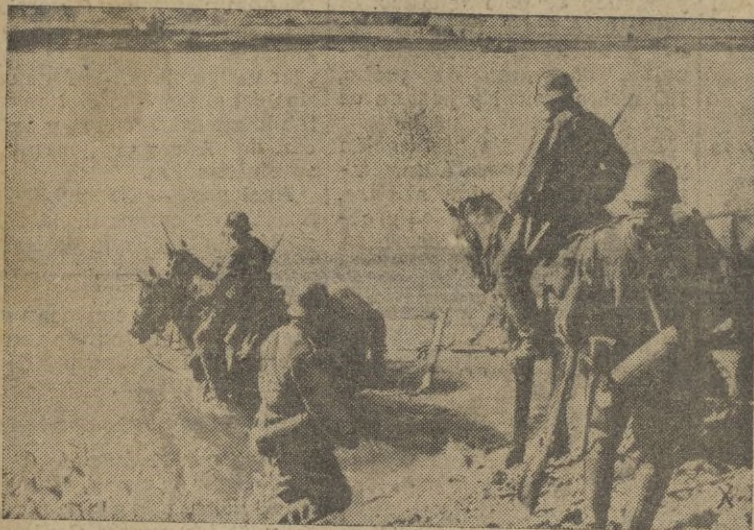
La vanguardia de una columna alemana se dispone a vadear un pequeño afluente del Don.