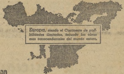
Europa, siendo el Continente de posibilidades ilimitadas, fecunda las obras más transcendentales del mundo entero.

Perfeccionando esta primera construcción, año tras año, se llegó a fabricar en el año 1940 la mayor locomotora eléctrica del mundo, con bastidor enterizo de 8.000 HP. de potencia, pudiendo arrastrar una carga de 360 toneladas a la velocidad de 200 kilómetros por hora.