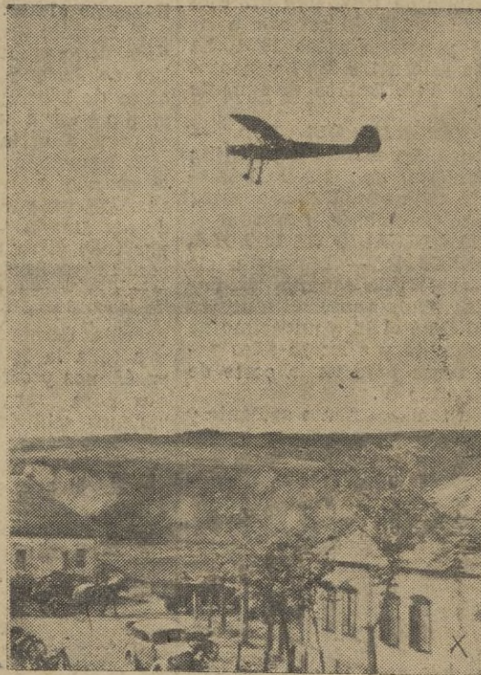
Una "Cigüeña Fieseler" se dispone a volar sobre las posiciones rojas más allá del Don.