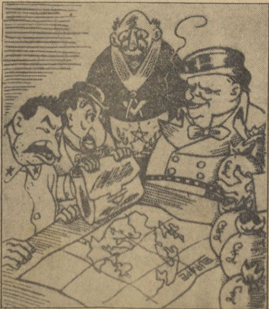
El Estado mayor de las cuatro naciones.