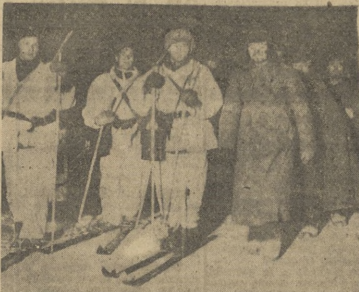
Esquiadores fineses conducen a buen número de prisioneros rusos.

Las tropas disponibles eran poco numerosas y no poseían armas. Después de una rápida preparación, se apoderaron, por sorpresa, de los arsenales rusos y desarmaron a los rojos. La guerra de independencia había comenzado: gracias al talento de su Jefe y al valor individual de sus solda-