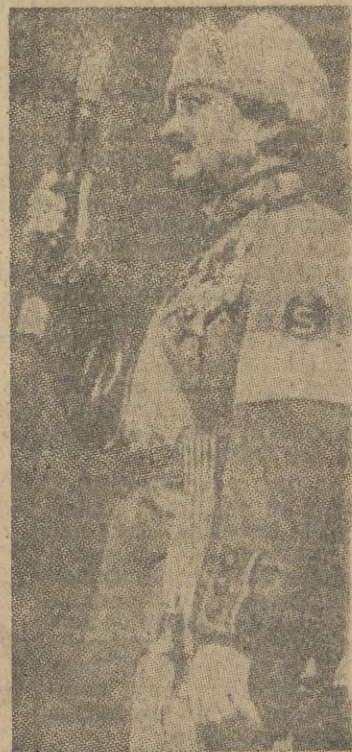
Cuartel General del Ejército de Finlandia, febrero de 1940", o sea en el momento más crítico de la guerra de invierno. Esta es la vigorosa personalidad del gran Jefe, que, por tercera vez, lucha a la cabeza de sus admirables soldados contra el mismo enemigo, para proteger y consolidar la independencia de su patria".

queológicas. Estas colecciones de documentos valiosísimos, han sido publicadas en 1941, en Helsinki bajo el título de "Journey across Asia" ("Viaje a través del Asia"). El prólogo del volumen lleva la fecha puesta en "En el Gran