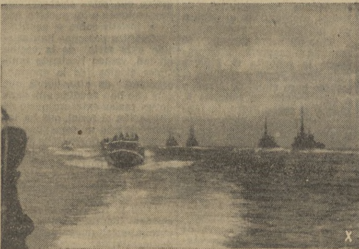
Lanchas rápidas de la escuadra alemana regresan de la jornada de vigilancia en la costa del Atlántico.