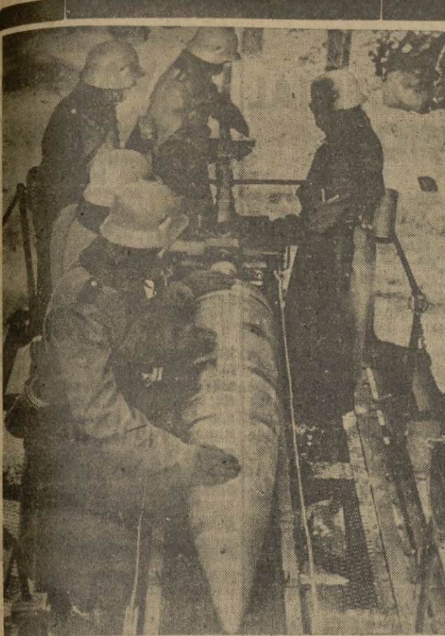
Artillería alemana de gran calibre. -- A través de la cureña el proyectil gigantesco se desliza hacia las entrañas del cañón

El ministro conversó con varios voluntarios con la llaneza (Pasa a la última)