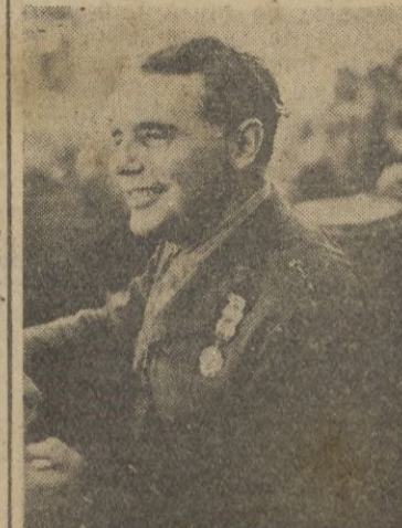
El Excmo. Sr. don Antonio Castejón Espinosa, general de brigada, según acuerdo del Consejo de ministros últimamente celebrado. (Cliché Faro).