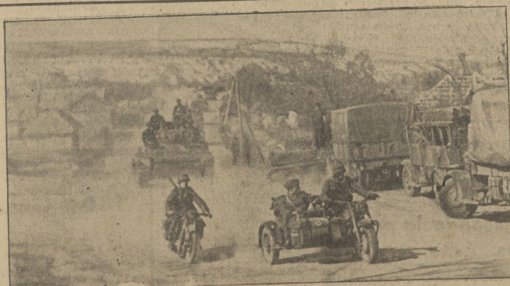
Uno de los caminos que conducen al frente, donde siempre hay gran tráfico de camiones alemanes de aprovisionamiento de municiones, tanques, soldados, etc.

Simultáneamente al "Rotestens" comunica que en el sector de Charcov las tropas blindadas alemanas lograron establecer una profunda cuña en las líneas y posiciones soviéticas, obligando también en otro punto del mismo frente a que los soviéticos abandonasen sus posiciones. — EFE.