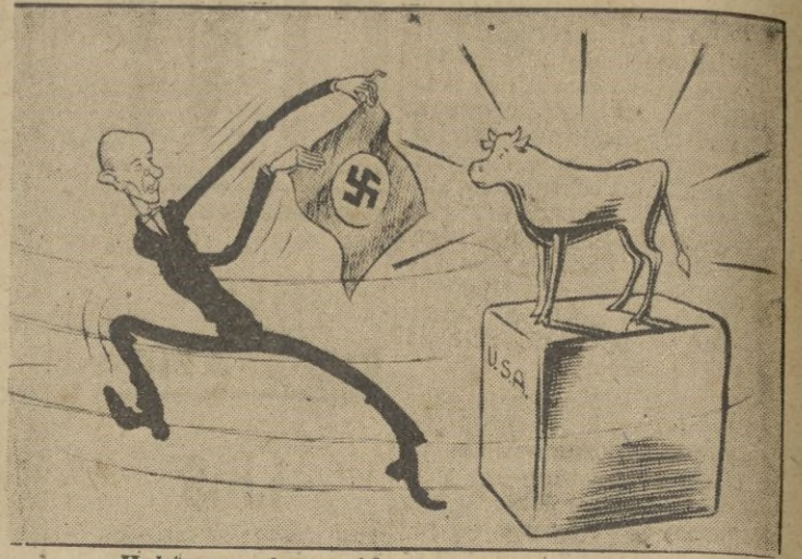
Hatifax en la corrida del becerro de oro.

En los círculos políticos de Washington se dice que con tal exposición de su opinión, Churchill querrá pronunciar seguramente un discurso defensivo, destinado principalmente a sus escuchas de Londres.—EFE.