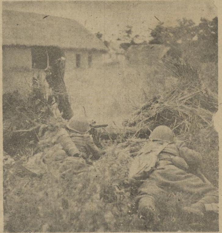
Atacando un fortín rojo en Sebastopol

En el curso de unos vuelos de reconocimiento sobre la bahía de Finlandia, la aviación ha hundido un submarino enemigo y averiado con bombas