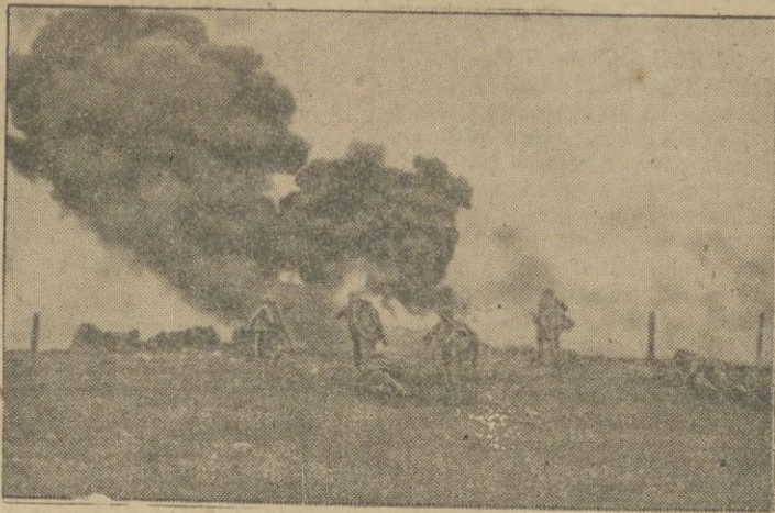
Lanzallamas en el frente.

Han sido derribados cuatro aparatos enemigos sobre Malta. — EFE.