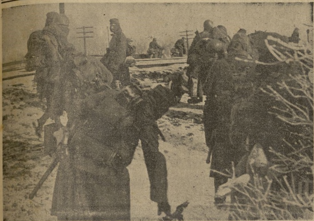
FRENTE RUSO: Tropas italianas en marcha hacia nuevas posiciones en el frente del Donetz.