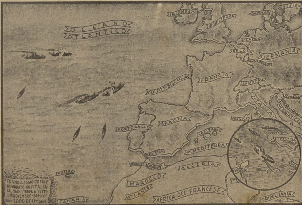
He aquí cómo un diario italiano refleja gráficamente el porcentaje de toneladas hundidas desde el 15 de noviembre de 1941.

El tema del concurso de artículos del mes de febrero será el de "Interpretación española de la muerte".