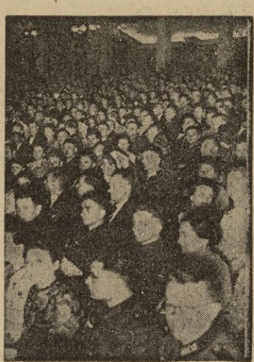
Una de las representaciones del "Día de la cultura del pueblo".

La conocida afirmación de que no se puede organizar la cultura queda desmentida con las realidades culturales alemanas, bajo la inspiración y la alta dirección de la Cámara Cultural del Reich, creada en 1933; que en la sucesión de los años, ni aun en los actuales de guerra, ha interrumpido su labor, sino todo lo contrario, fomentándola más y más, en sus Cámaras especiales dedicadas a las distintas ramificaciones del mundo cultural y artístico, y en su Senado de la Cultura del Reich, presidido por el Ministro Dr. Goebbels, del que forman parte 80 personalidades destacadas, entre ellas Gruedgens, Emil Jannings, el maestro Furtwaengler, arquitecto del Führer profesor Speer, el ministro Funk, el jefe de las tropas de asalto Himler, y otros varios.