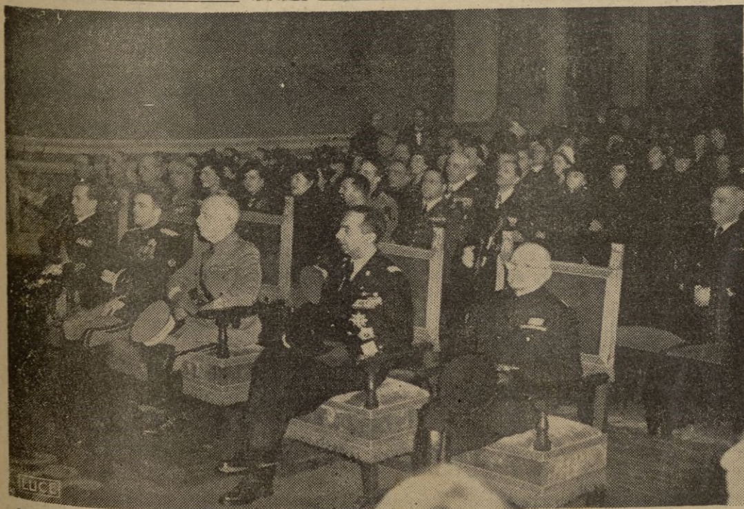
ROMA. — Conmemoración del centenario de Galileo Galilei en el Campidoglio en presencia del Rey Emperador

El miércoles próximo se reanudarán las audiencias pontificias con la sola excepción de los besalamanos. — EFE.