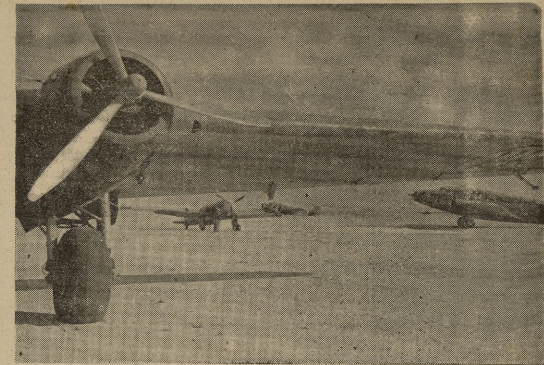
Aviones de bombardeo italianos en un campo de aviación de Africa del Norte.

Tokio, 13. — El nuevo embajador del Japón en Moscú, señor Satch ha salido hoy de Tokio para incorporarse a su puesto. — EFE.