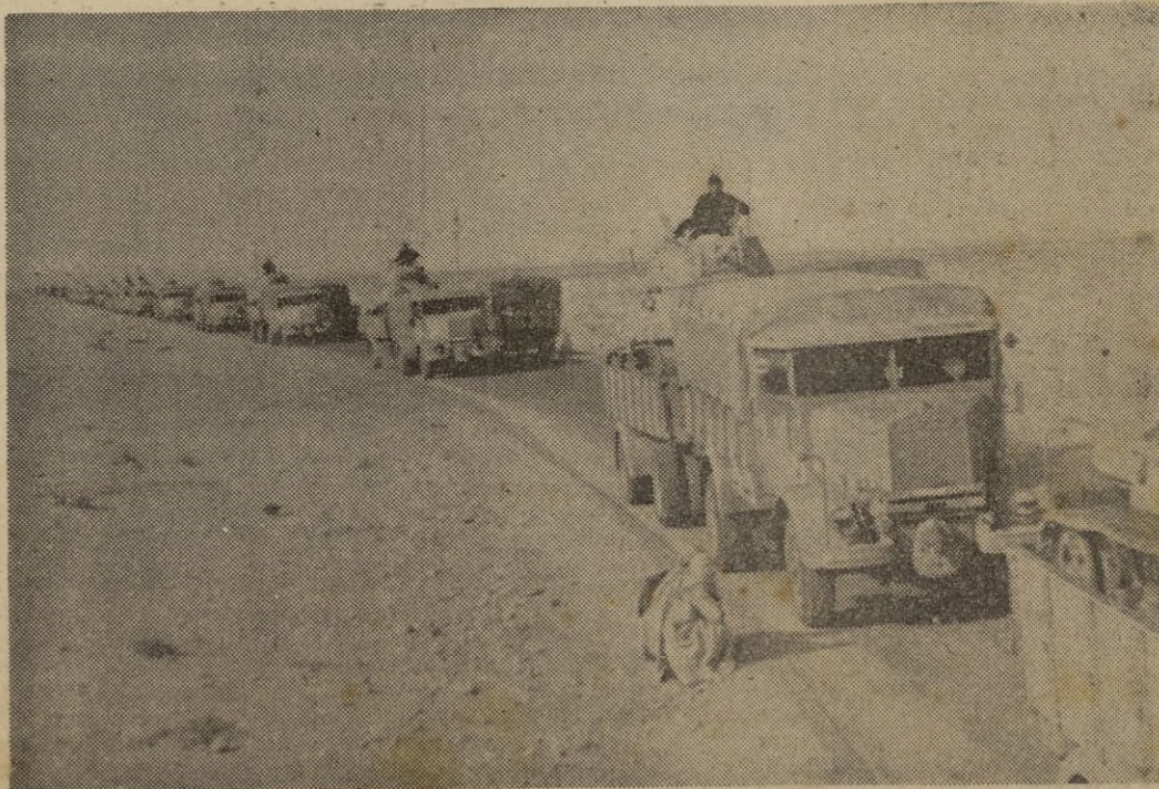
AFRICA DEL NORTE: columnas italianas de abastecimiento en la carretera de Balbia.

Acudieron a la estación a despedirla el Gobernador civil y jefe provincial del Movimiento, el alcalde y otras autoridades y jerarquías, así como numeroso público, que la hizo objeto de cariñosa despedida. — CIFRA.