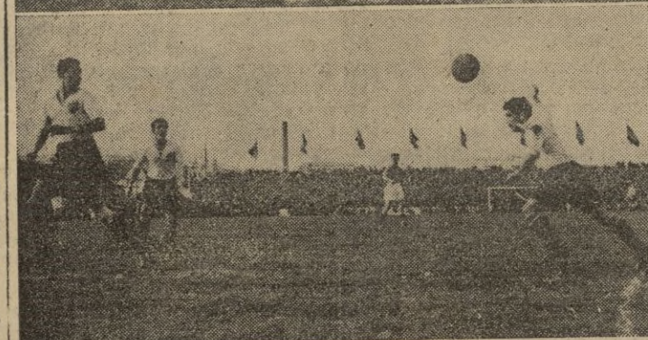
Momentos más interesantes del partido.

pre fallan a la hora de la verdad. En un ataque de los galos Martorell tiene que despejar a corner. Hace el ataque Aston pero resulta corto. Lugo se registra otro corner contra Francia, que Epi tiro abierto y es rechazado por los franceses. Los delanteros españoles hacen una jugada emocionante que remató Bravo pero el esférico salió fuera. Presionan durante unos momentos los franceses pero muy pronto tiene que intervenir, arriesgadamente el guardameta galo para salvar un peligroso tiro.