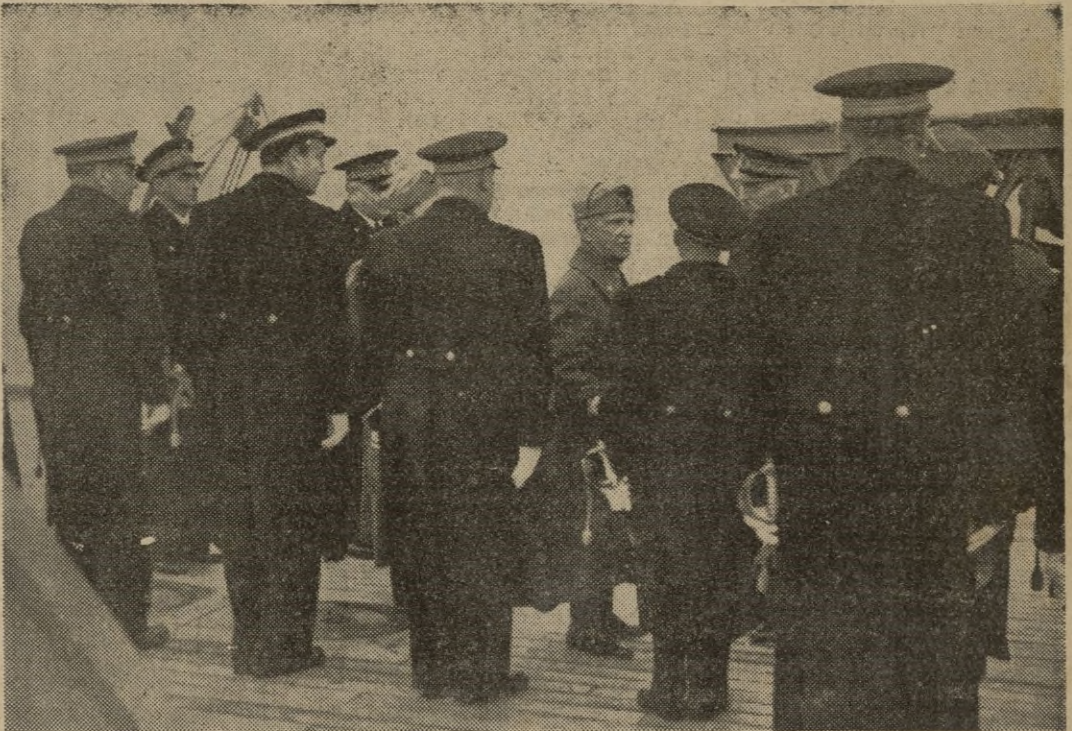
Viaje de S. M. el Rey Emperador a Italia meridional: En una base naval son presentados a S. M. los comandantes de los buques de guerra.

Terminado el acto se sirvió un refrigerio en el comedor de oficiales y las autoridades militares alemanas brindaron por el éxito de los aviadores españoles. — EFE.