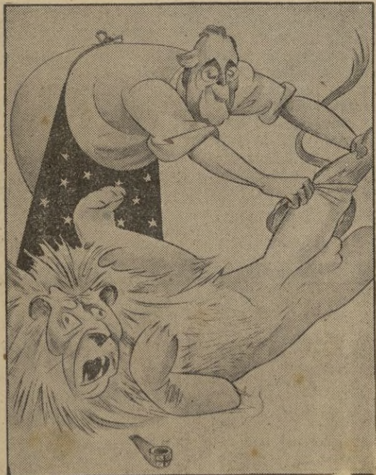
Canadá "Goddam". --No podría esperar hasta que ya esté muerto?

Si los japoneses consiguen cortar las aguas situadas inmediatamente al Norte del Continente australiano conquistando bases de apoyo navales y aéreas, entonces, los envíos de material y los transportes de tropas procedentes de América que se dirijan al centro del escenario de la guerra del Lejano Oriente tendrán que dar un largo rodeo pasando por el Estrecho de Bass y toda la costa Occidental australiana, lo que equivaldría a una limitación en el tonelaje de guerra de los aliados que de por sí es ya limitado siendo este el principal obstáculo que se opone a un rápido y suficiente refuerzo de la posición de los aliados en aquel teatro de la guerra. — D. B.