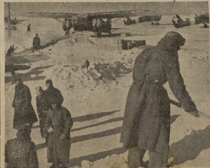
FRENTE RUSO: Un campo de aviación italiano.

Madrid, 17. — El diario «Arriba» publica con este título un editorial admirable, dedicado a salir al paso de las insidias de los eternos enemigos de la Falange. — CIFRA.