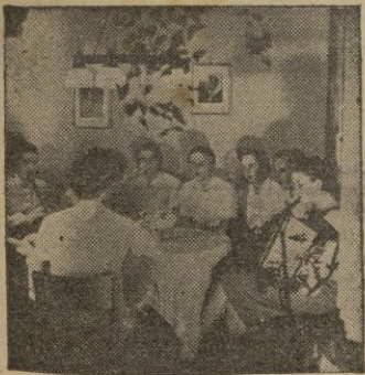
En la hora del descanso.

Este, uno de los tantos días de cuestión, y estas muchachitas españolas, que cumplen tan sagrado deber patriótico, nos recuerda otras,