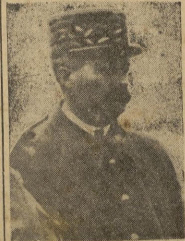
Paris, 30. -- (Urgente). -- Se afirma que el general Giraud ha sido detenido en las proximidades de la frontera italiana. -- EFE.