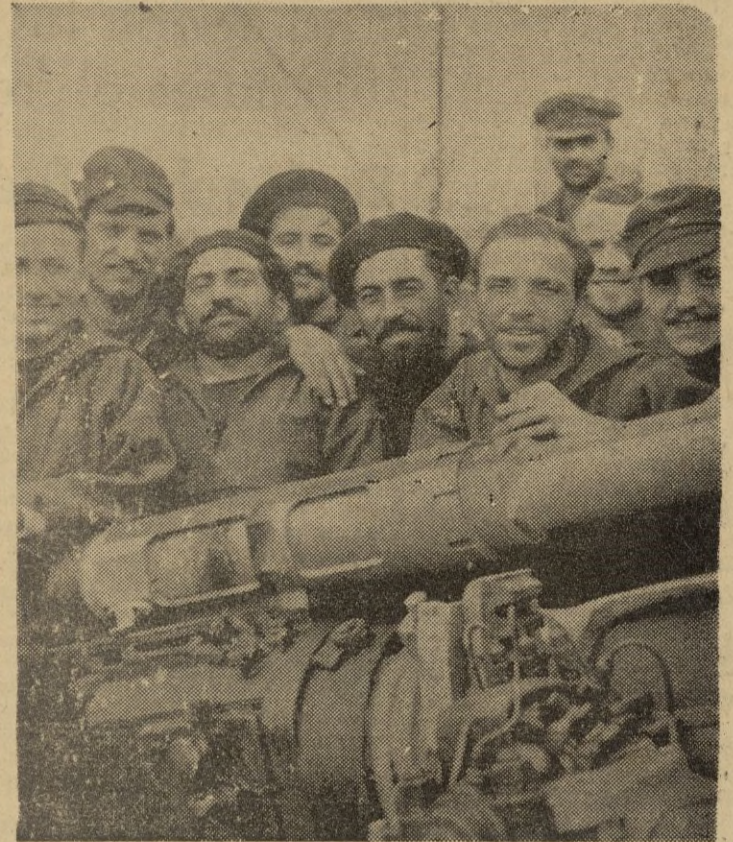
Submarino italiano que después de victoriosas hazañas en aguas americanas regresa a su base

Dice también el referido corresponsal que después de cuatro meses de lucha, el estado de las tropas británicas es de agotamiento y grandemente decaído, pues ya no queda nada del brillante ejército que salió a hacer la campaña. Sus uniformes están hechos girones por las ramas de los arbustos y los zapatos se los tienen que quitar a los cadáveres que los japoneses los producen. Las ropas interiores de estos cadáveres se las ponen los demás sucias y rotas y su última esperanza es la estación de las lluvias que podrá refrescar la temperatura que en toda Birmania se siente. — EFE.