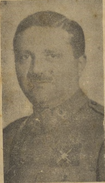
Sr. General don Juan Bautista Sánchez, que recibió ayer el homenaje del Ejército del territorio, y al que el pueblo de Ceuta muestra estos días su afecto y gratitud, con motivo de su próxima y sentida marcha.