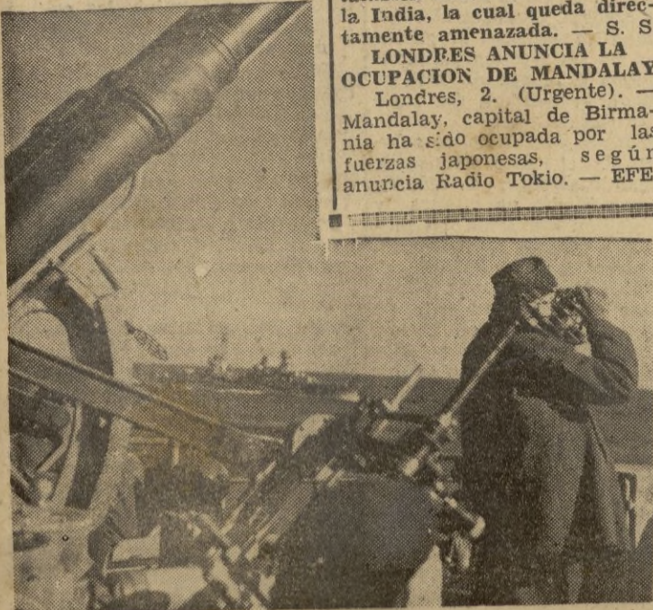
Unidad de la Marina de guerra dando escolta a un convoy italiano que se dirige a Africa septentrional