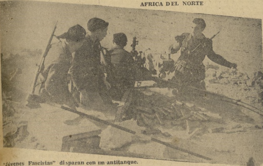
"Jóvenes Fascistas" disparan con un antitanque.