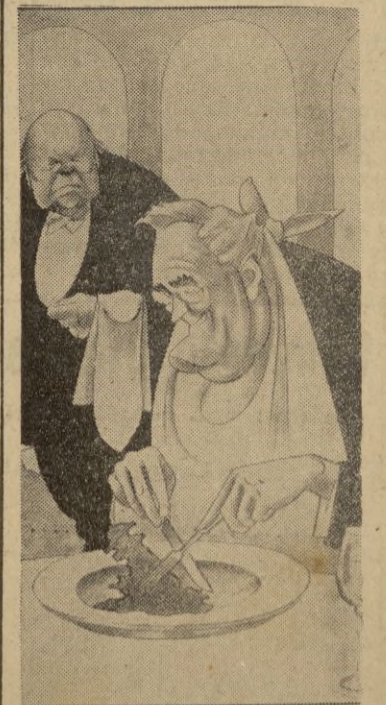
La "vuelta" de Inglaterra a los Estados Unidos