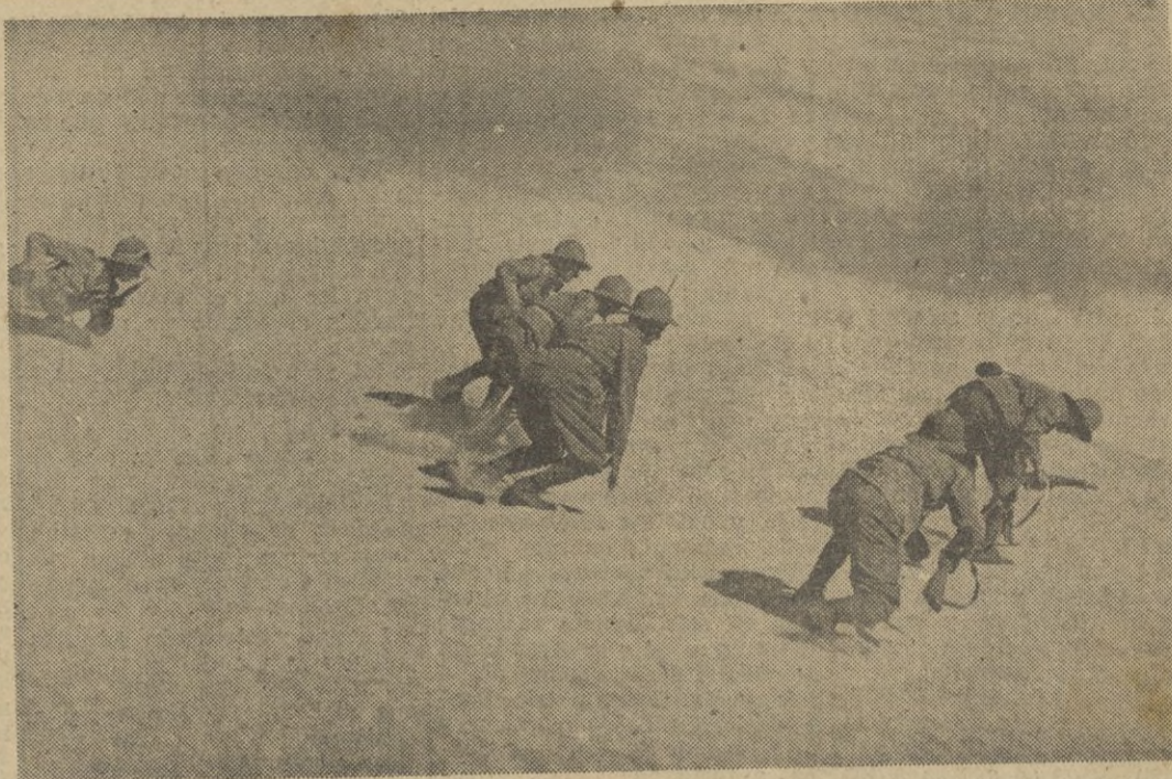
Soldados italianos al ataque a una posición inglesa en el desierto libico. --

De estos, ochenta y dos fueron hundidos en aguas del Atlántico y América. -- EFE.