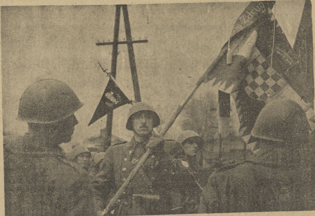
Una legión croata se integra al Cuerpo Expedicionario Italiano en Rusia.

Todas las baterías ordinarias de la DCA alemana serán dotadas de este tipo".—EFE.