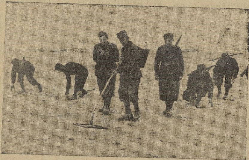
Zapadores italianos a la busca de minas con el aparato electro-magnético. En el sector de El Mechili, fueron inutilizadas 6.000 minas anti-carro