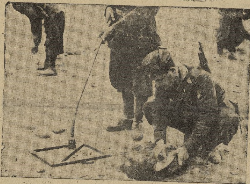
Zapadores italianos inutilizando una mina anti-carro