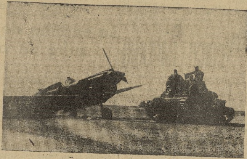
Un carro armado de la división "Ariete" pasa cerca de un "Curtis P. 40" inglés abatido.