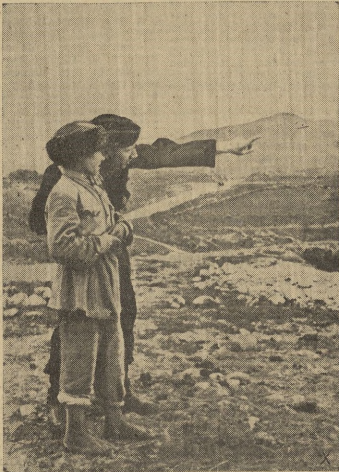
El benjamín de una aldea caucásica orienta al soldado tanquista alemán acerca del mejor camino a través de la montaña.