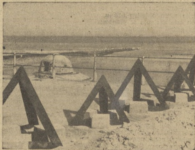
Obstáculos anti-aéreos y muros de ametralladoras.

El gran ataque desencadenado en la mañana del lunes por el octavo ejército británico que había concentrado todas sus fuerzas disponibles, todos sus carros de combate y su artillería, ataque destinado a liquidar la batalla que se libra desde hace diez días en