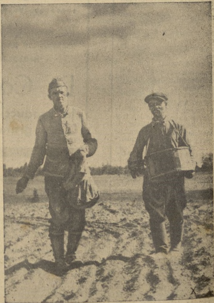
El soldado alemán, ayuda al campesino ruso, libre ya del yugo bolchevique, en las faenas de la siembra otoñal

Tanto menos se comprende, si también las victorias que puedan alcanzar los ingleses el día de mañana, han de valer igualmente como tales. ("Il Popolo d'Italia", de Milán).