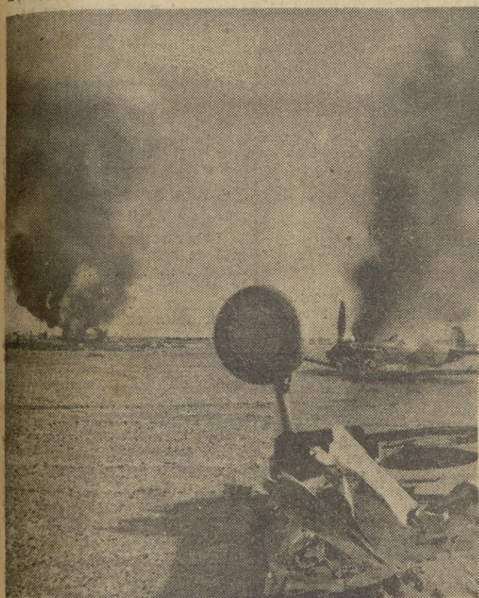
Un dramático documento de las recientes batallas aéreas en el frente egipcio: tres aparatos de caza ingleses derribados en un área de pocos centenares de metros.

Después de bendecidas las enseñas, por el asesor religioso de la Organización, el jefe provincial del Movimiento efectuó la ofrenda con sentidas palabras, a las que contestó en nombre del grupo de divisionarios, el capitán Masip. — CIFRA.