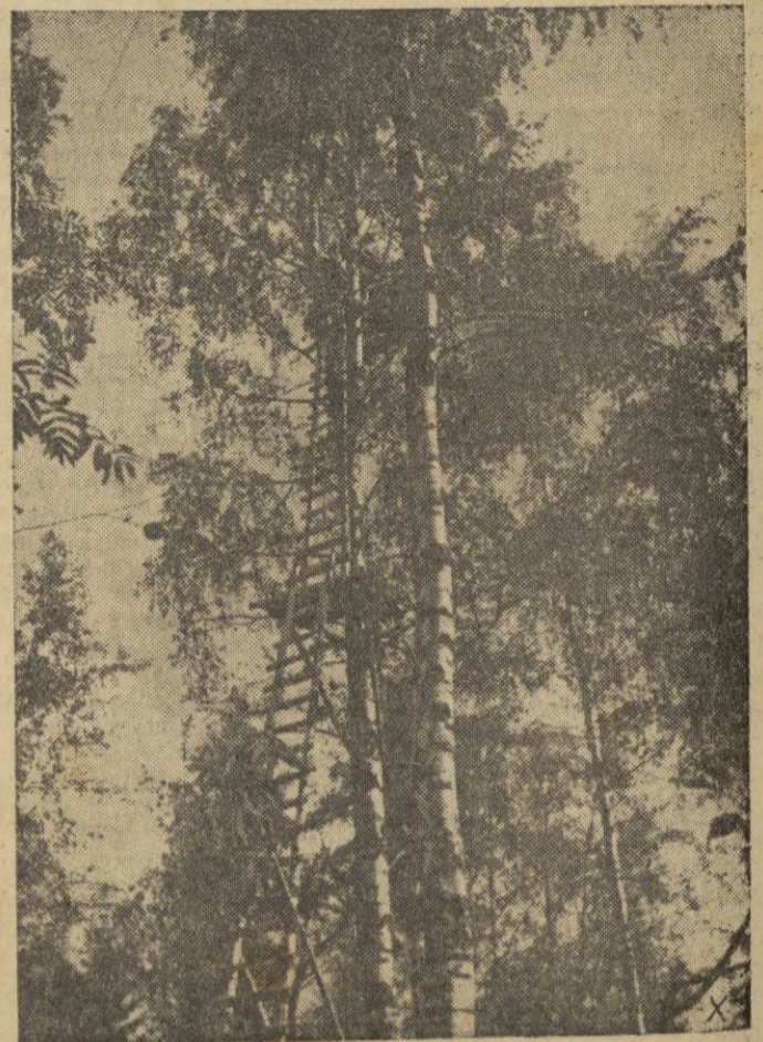
Desde lo alto del árbol se observa perfectamente los movimientos del enemigo.

No olvides tu aguinaldo para los heroicos voluntarios de la