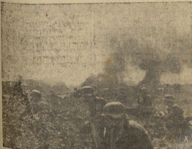
Fuerzas de choque alemanas se preparan para tomar al asalto una estación soviética.