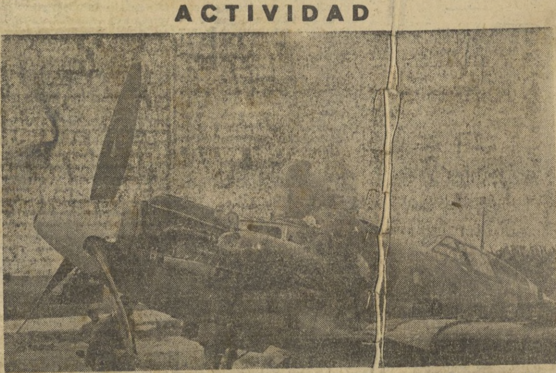
Cazas italianos son revisados al regreso de una misión de guerra para salir nuevamente.

El Caudillo penetró después (Pasa a la cuarta)