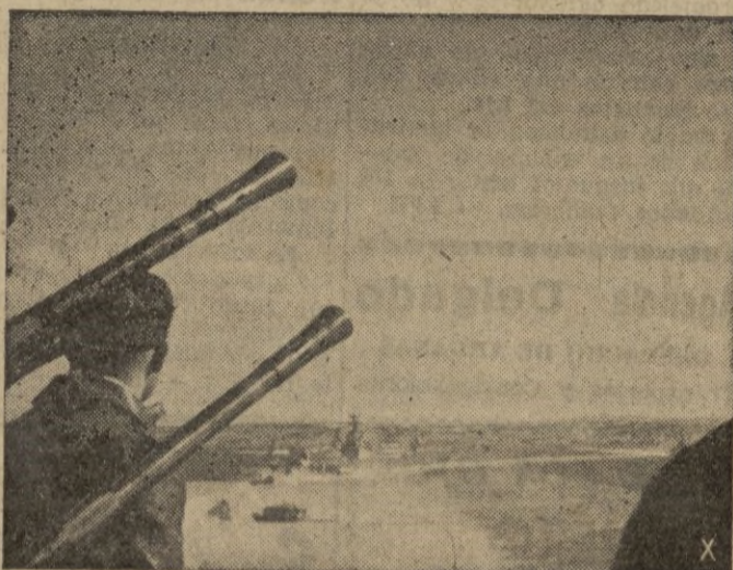
Unidades de la Marina alemana patrullan por el Mar del Norte.

y a los suboficiales y soldados con dos criaturas.