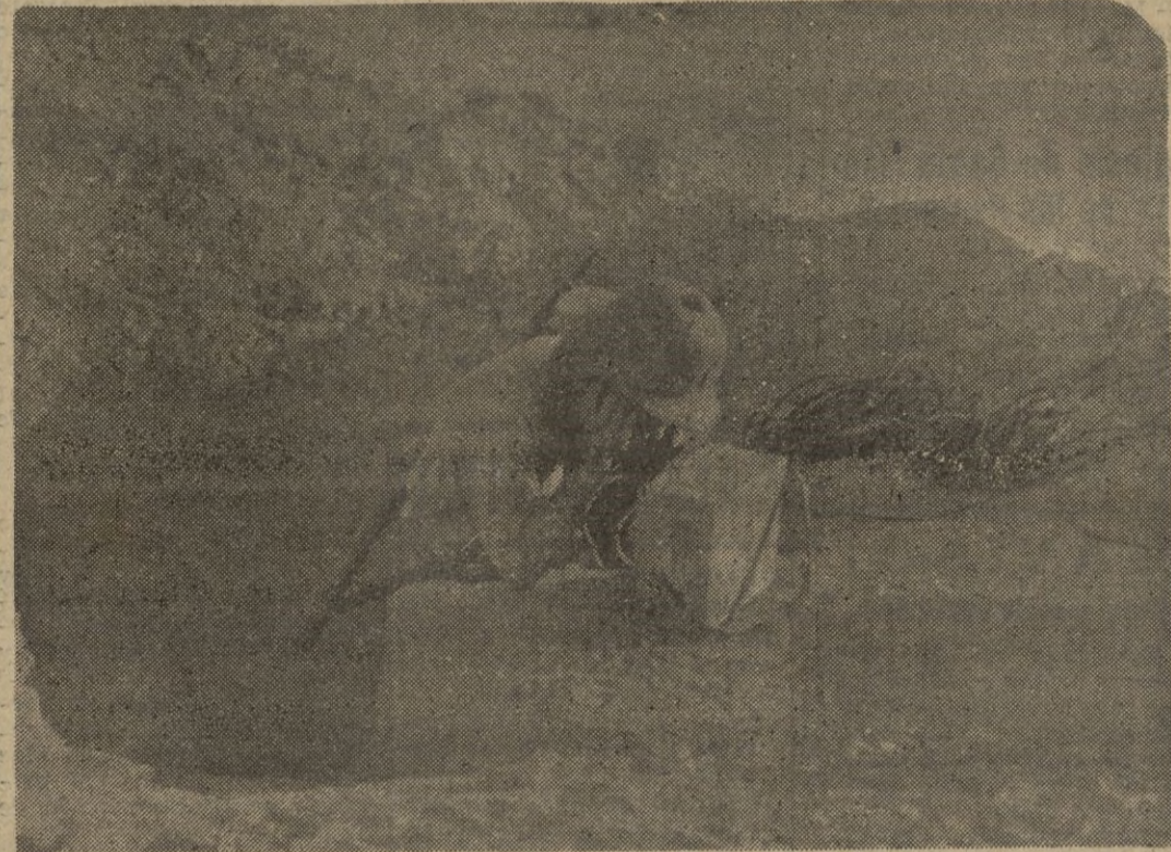
Telefonista al habla con el Mando de una unidad italiana operante en Africa del Norte

acordado contribuir con cinco mil pesetas. — CIFRA.