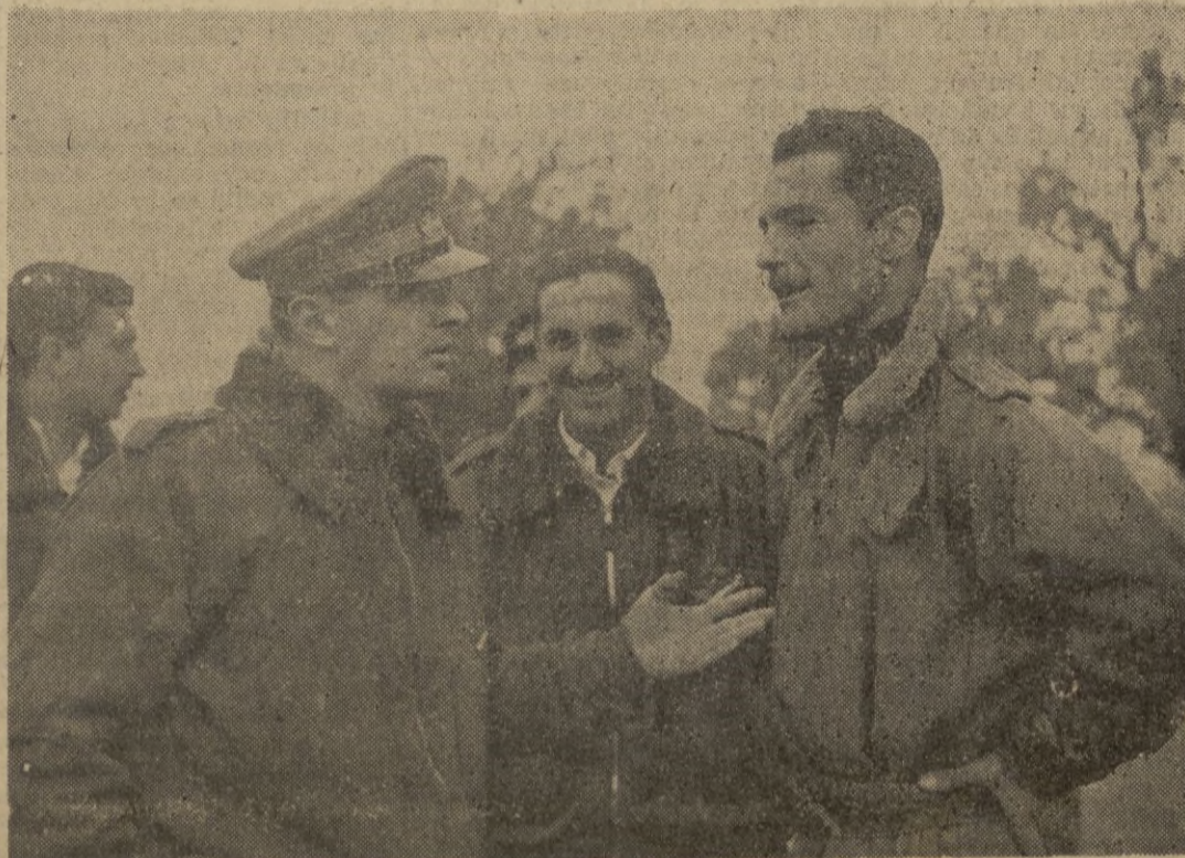
El comandante piloto italiano Carlo Emanuele Buscaglia (con la gorra) caído en la última acción contra la flota anglo-americana.