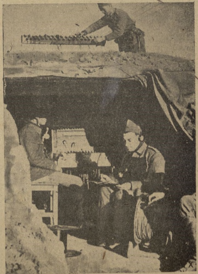
Central telefónica alemana en el frente de Stalingrado