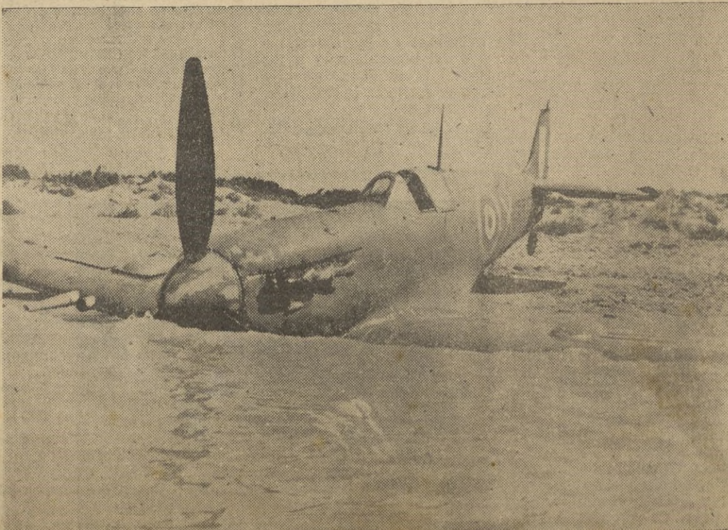
Avión de caza inglés obligado a aterrizar por un caza italiano en el cielo de Ragusa.

Dicho total se compone de 74 unidades hundidas, 19 probablemente hundidas y 22 averiadas. — EFE.