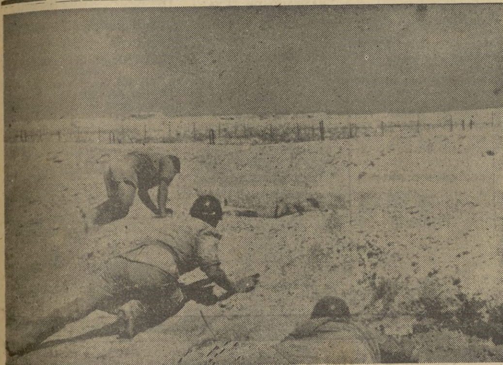
Soldados italianos durante una operación en la zona de El Alamein.